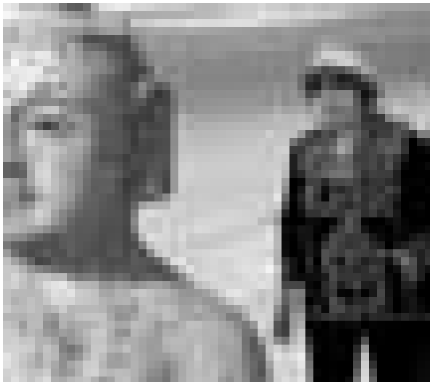
Agnès Varda se met en scène dans une sorte d'autodocumentaire. « Les plages d'Agnès ». Cinédit à l'Utopia.