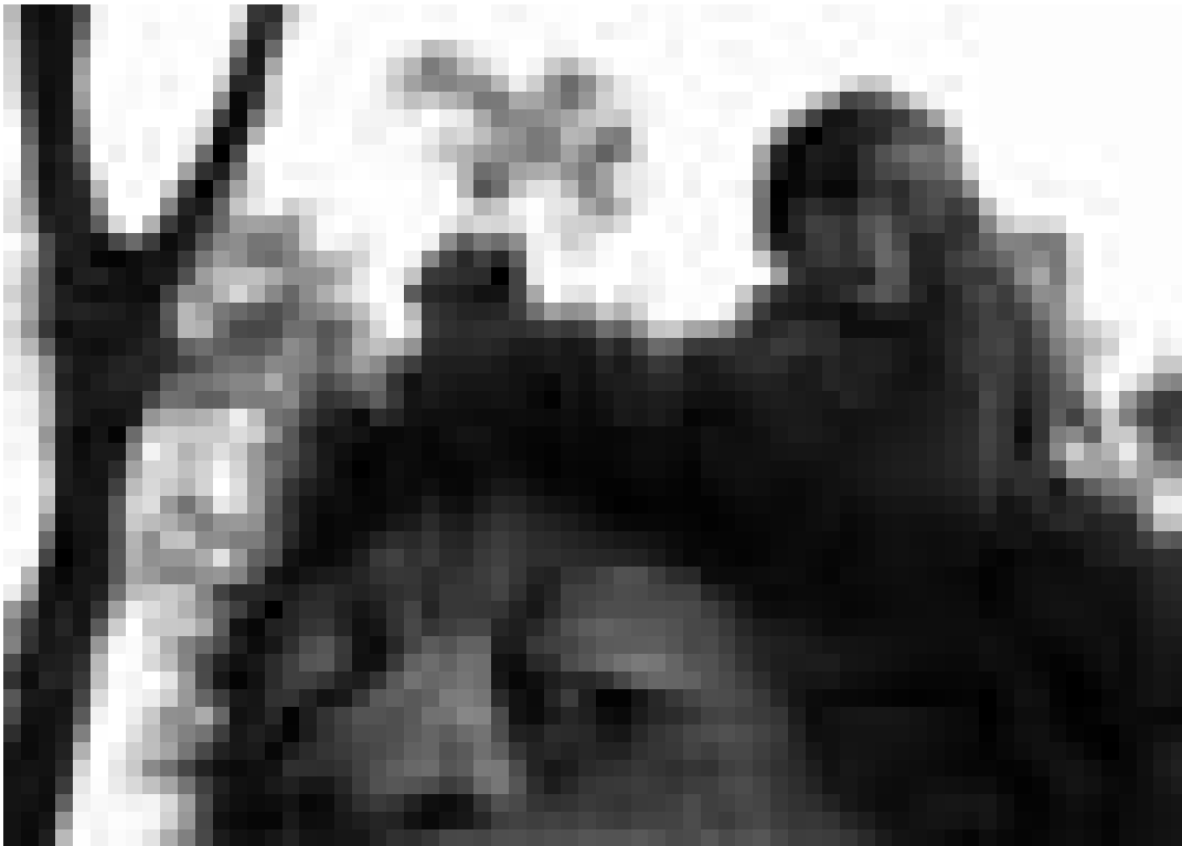
Die Furcht bei den Hörnern packen ...