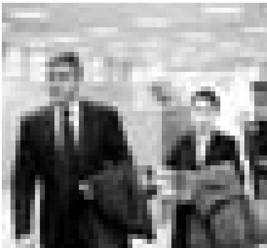
Ryan ist dauernd beruflich unterwegs. George Clooney und Anna Kendrick in „Up in the Air“. Vorpremiere und Spezialvorstellung zum 1. Jahrestag des CinéBelval.