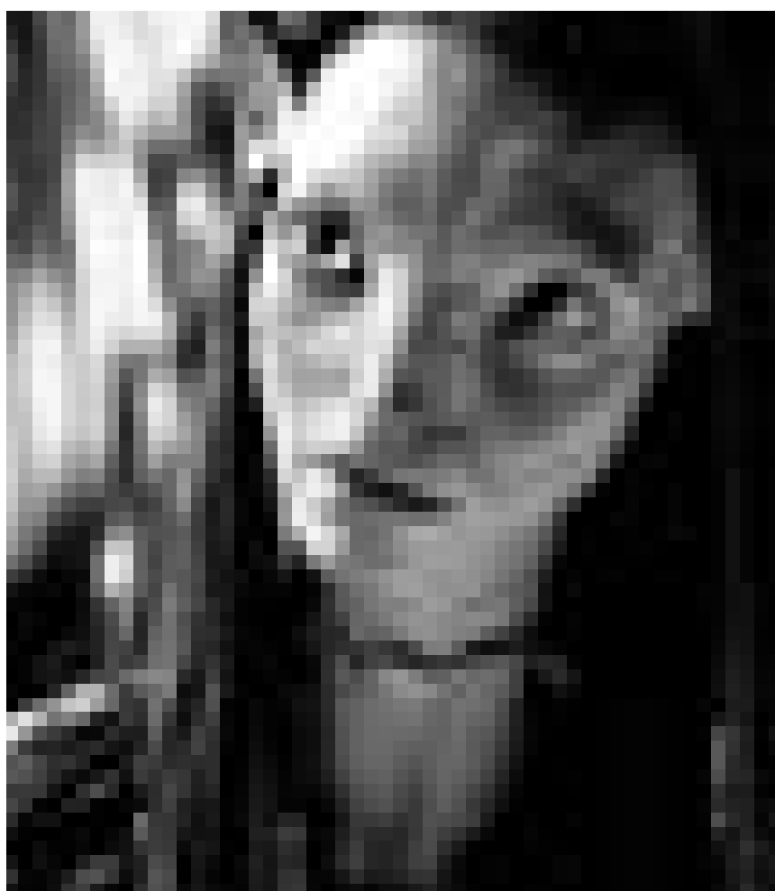
Eine Na'Vi: fremdartig aber schön. Zoe Saldana in „Avatar“. Neu im Utopolis, Starlight, Ariston, CinéBelval und Kursaal.

XXXX = excellent XXX = bon XX = moyen X = mauvais