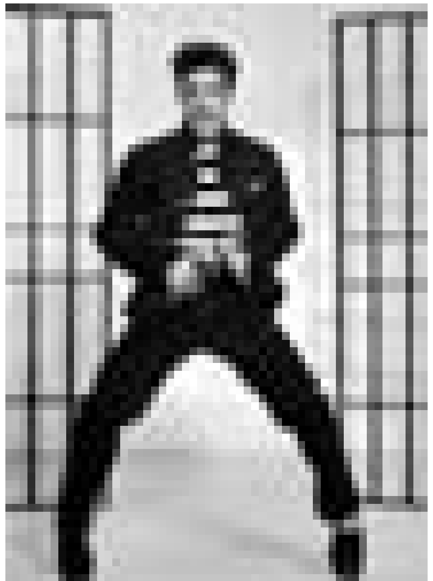
Elvis Presley dans son meilleur film « Jailhouse Rock », samedi à la Cinémathèque.