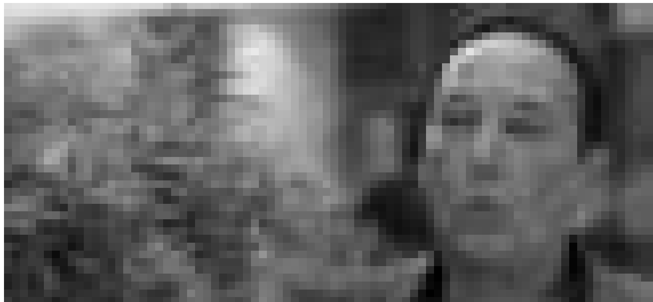
Armand coule une pré-retraite dorée sous le soleil de la Côte d'Azur. François Berléand dans « Le siffleur ». Nouveau à l'Utopolis.

D 2009, Jugendfilm von Lars Büchel. Mit Moritz Bleibtreu, Anke Engelke und Uwe Ochsenknecht. 101'. O.-Ton. Ab 6.