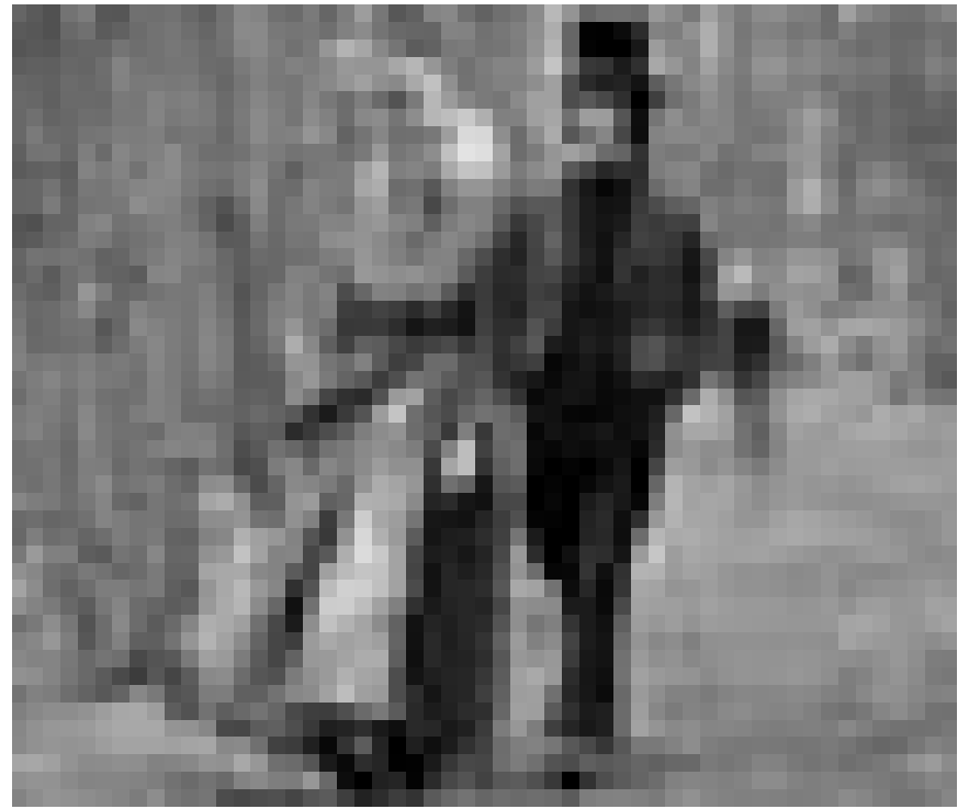
Eine scheue Romanze im frühen 19. Jahrhundert. Abbie Cornish und Ben Whishaw in Jane Campions „Bright Star“. Neu im Utopia.

Der Rentierjunge Niko lebt mit seiner Mutter und der Herde in einem verschneiten Tal. Seinen Vater hat er