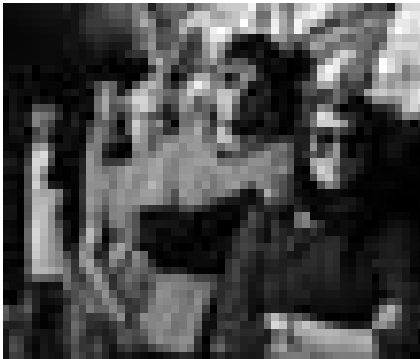
Des jeunes musiciens de Téhéran veulent se produire et s'éclater. « Les Chats persans » de Bahman Ghobadi. Nouveau à l'Utopia.