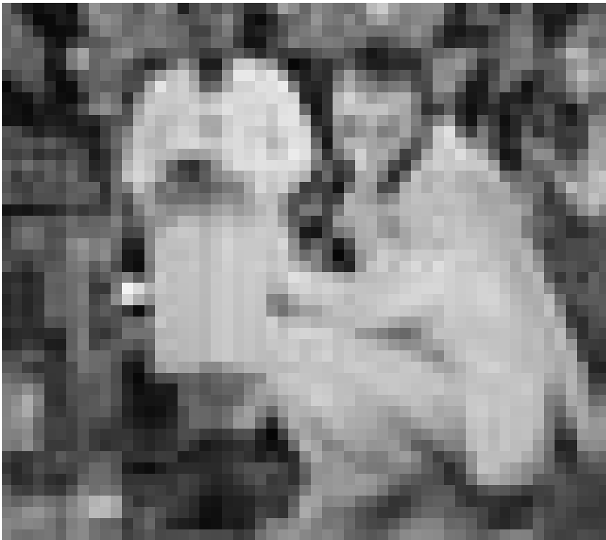
Derrière le miroir se trouve le monde des désirs secrets.