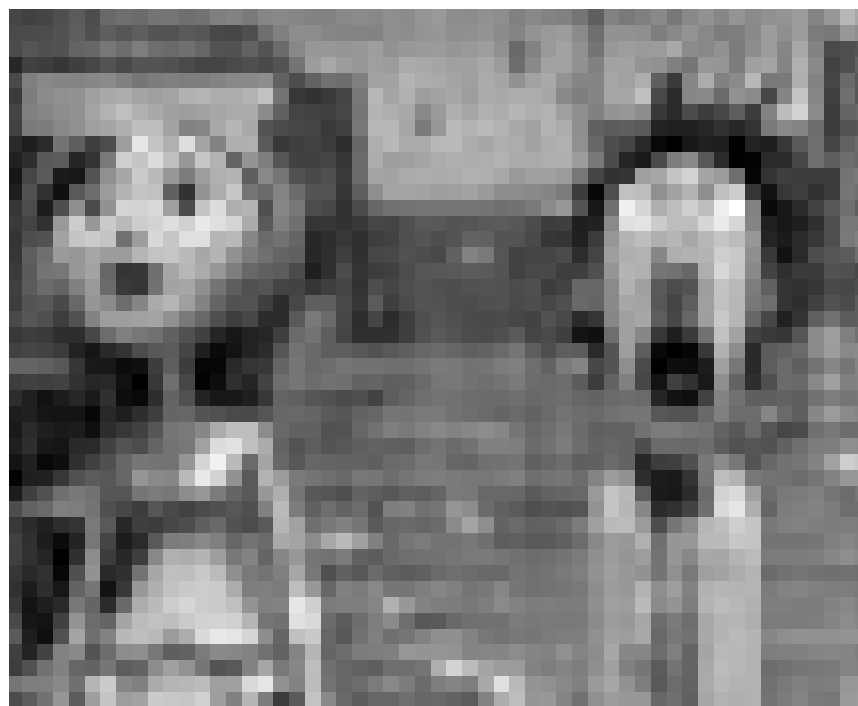
Flints Erfindung erfreut Hungrige. „Cloudy With A Chance of Meatballs“, Animationsfilm von Phil Lord und Chris Miller. Neu im Utopolis und CinéBelval.