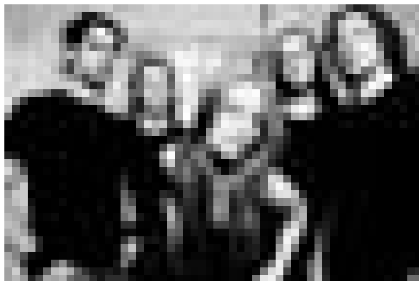
Eingefleischte Fans von Gothic-Bombast-Rock werden an diesem Samstag auf ihre Kosten kommen: Die holländische Band Epica gastiert dann im hauptstädtischen Atelier.