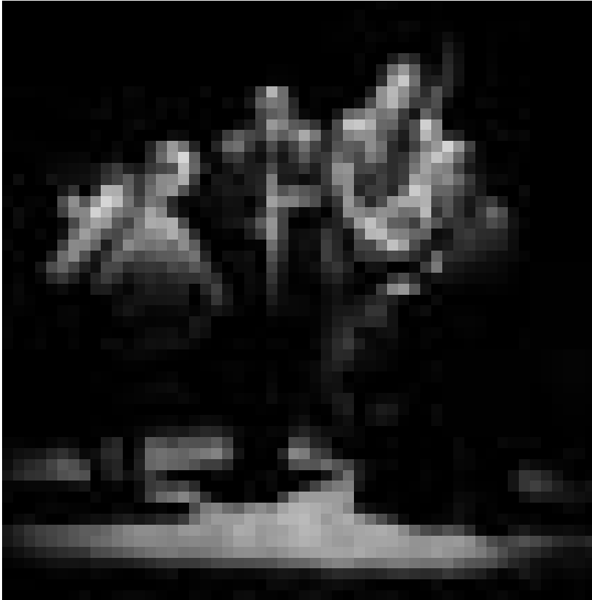
Die Tonpoesie von Quadro Nuevo entzieht sich allen Genre-Schubladen: Die Träger des Deutschen Jazz Award gastieren am 24. Januar in der Tetinger Schuhfabrik.