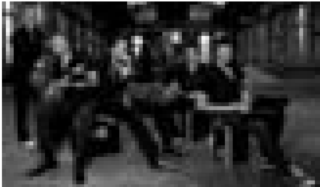
Ils s'expriment de préférence sur scène, et leurs concerts incitent les spectateurs à passer une excellente soirée, loin des petits tracass quotidiens : B.B. and the Blues Shacks sont à l'affiche du premier concert 2010 du Blues Club Lëtzebuerg, ce vendredi 22 janvier.

Der König ohne Schuhe , mit der Cie 4HOOG, Gent, Carré Rotondes, Luxembourg , 17h. Tel. 26 62 20 07.