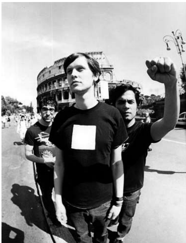
Le rock indépendant est au rendez-vous ce vendredi, avec New Idea Society et Jordan.