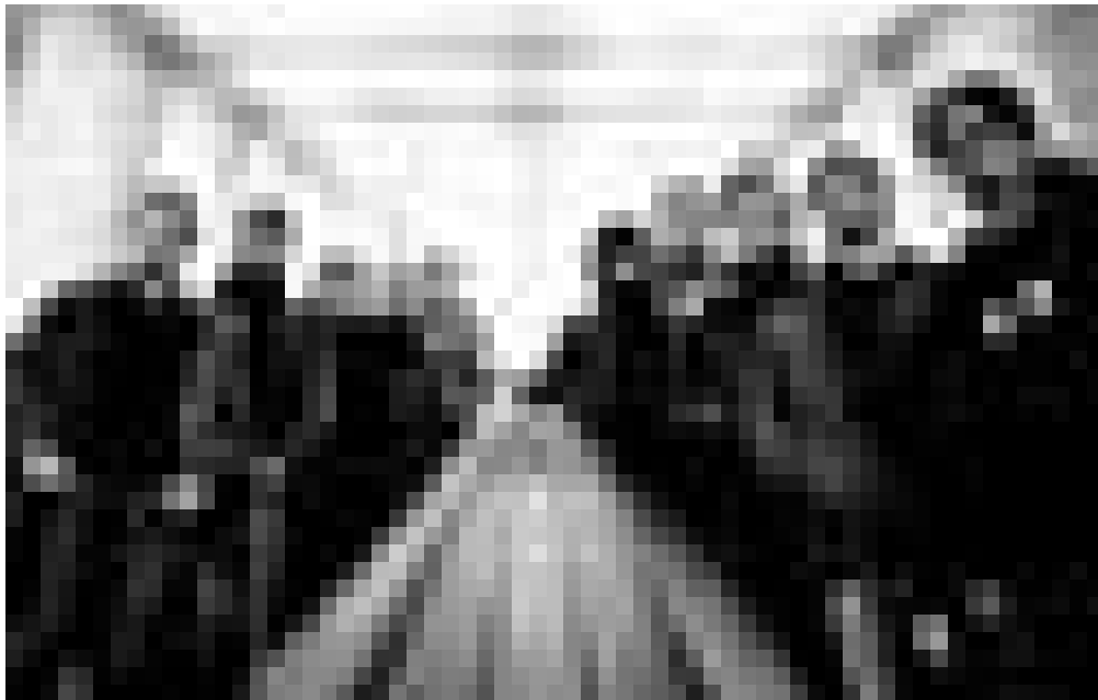
Ont redéfini les frontières du jazz et de l'electro : Jaga Jazzist.