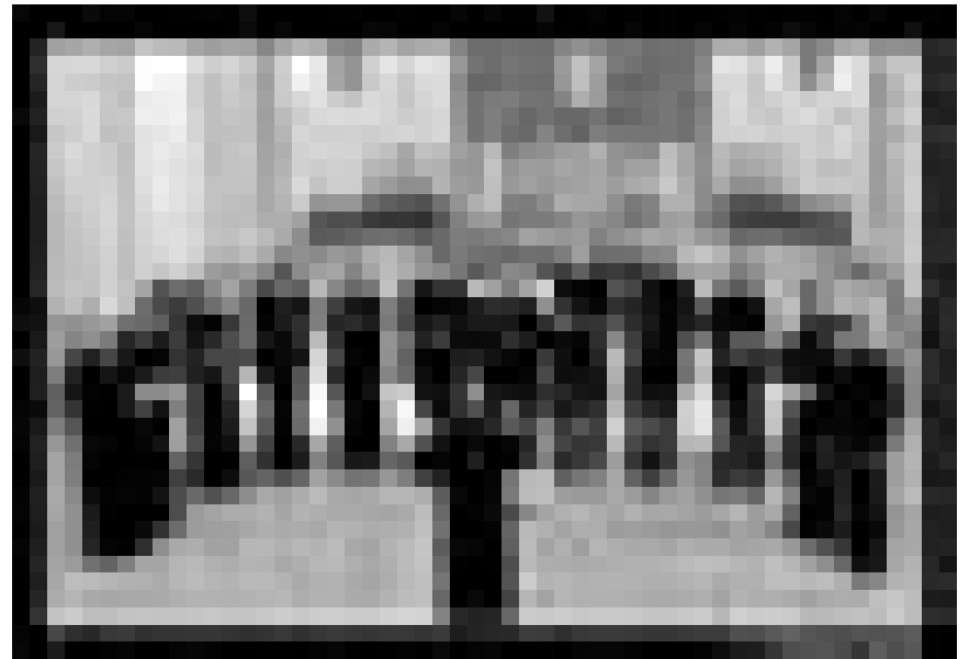
Chantent les bienfaits d'une vie sans excès : l'Ensemble Vocal Euterpe ce vendredi à l'église protestante de Luxembourg.