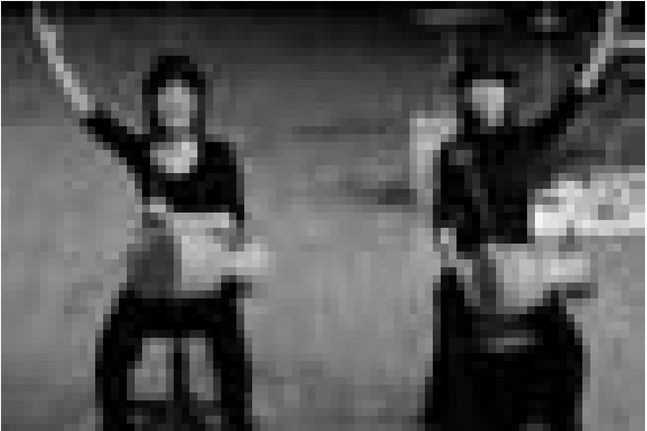
Le duo taiwanais NanaFormosa fera vibrer le Centre des Arts pluriels d'Ettelbrück, ce dimanche 28 février.