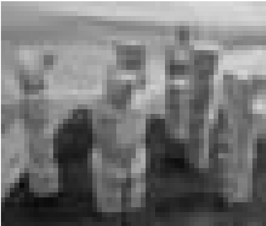
Zeigen aus welchem Holz sie geschnitzt sind: Die KünstlerInnen der Edith Maryon Kunstschule in Freiburg/Munzingen stellen ab dem 10. April auf Schloss Bourglinster aus.