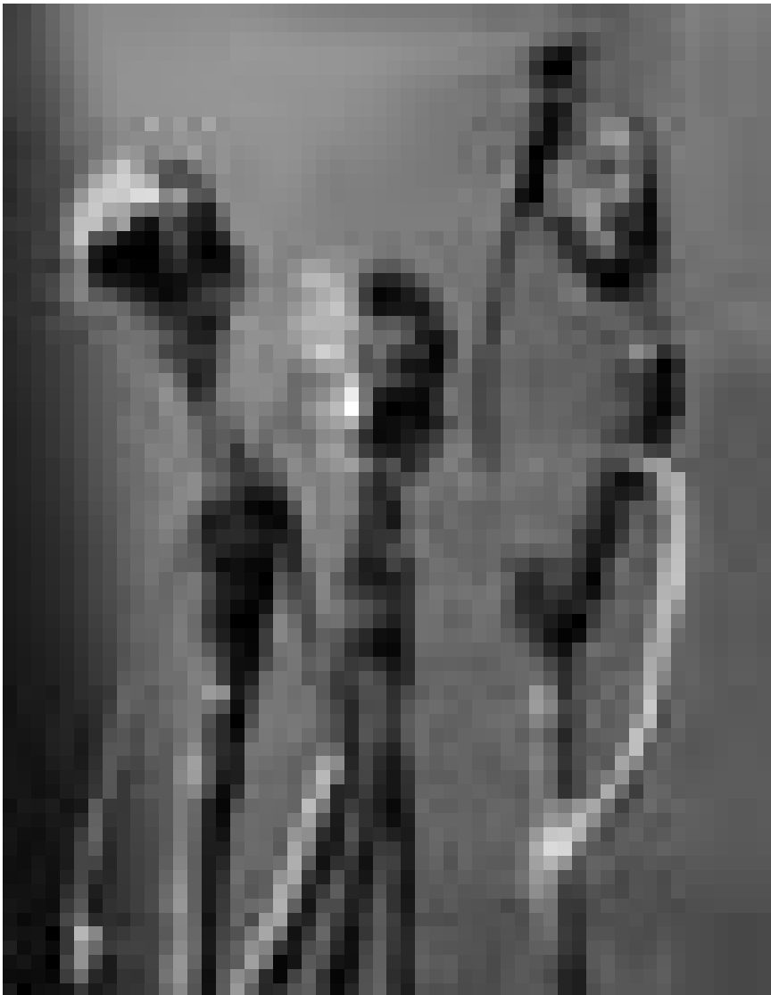
Ils semblent se poser plein de questions métaphysiques : les sculptures d'Haude Bernabe et les peintures de Christian Collin sont visibles à la galerie Rectoverso à Rodange, jusqu'au 30 mai.