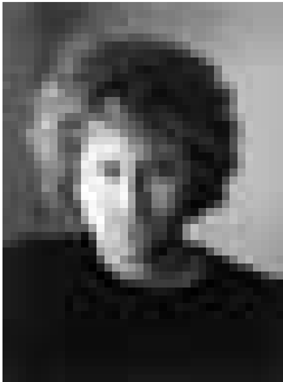
Seine Musik ist so eigensinnig wie sein Haupthaar: Raúl Paz.