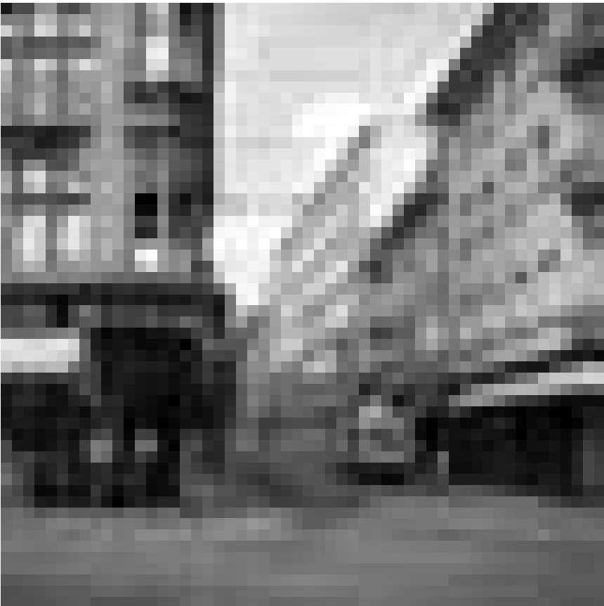
...« Quand l'Europe emménageait à Luxembourg ». Exposition de photographies historiques au Grand Théâtre. Vernissage ce vendredi, 7 mai, jusqu'au 2 juillet.

NEW Galerie « Op der Kap » (70, rte d'Arlon, tél. 26 10 35 06), jusqu'au 29.5, me. - di. 14h - 19h.