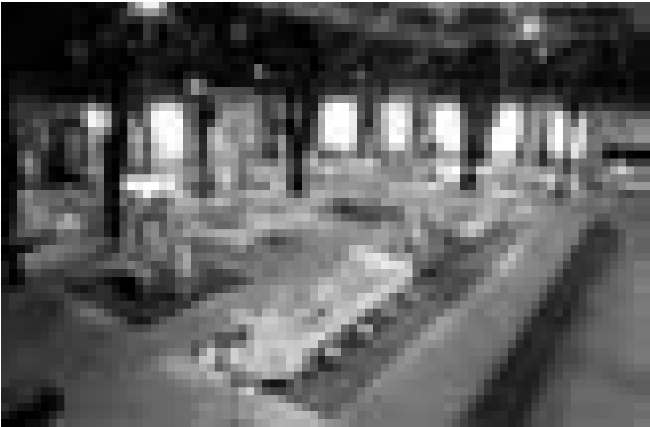
Mal wieder was dazulernen? Das „Studio ABC“ - das interaktive Kunstentdeckungsstudio macht im Carré Rotondes halt und legt seinen Schwerpunkt auf Architektur. Bis zum 30. Mai.

« La sculpture (...) remplit parfaitement les besoins d'un art public et contemporain : esthétique, contenu et interactivité sont réunis dans un ensemble harmonieux. » (Ic)