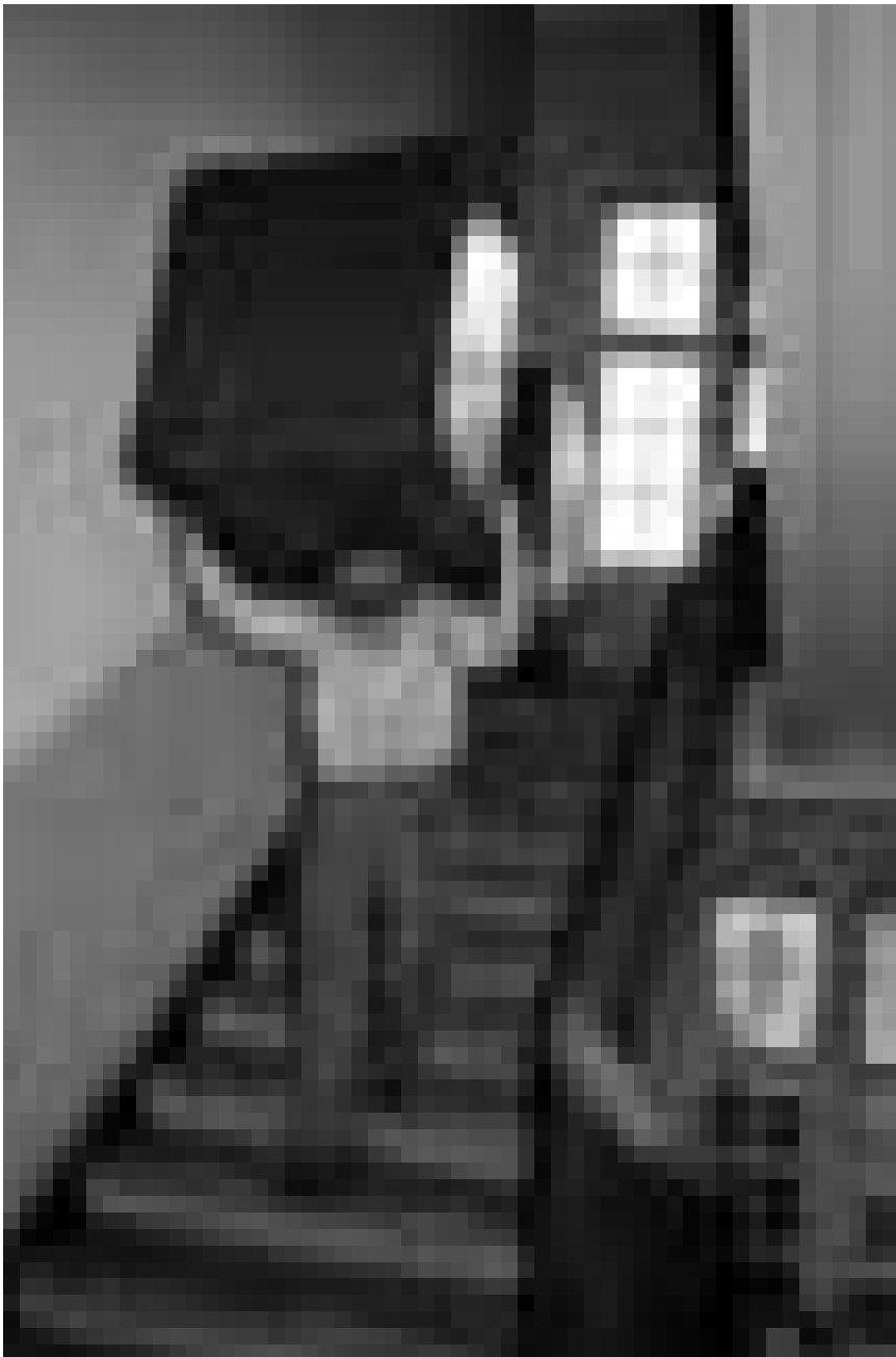
Attention, ça déménage !!!...

Musée National d'Histoire Naturelle (25, rue Münster, tél. 46 22 33-1), Luxembourg, ma. - di. 10h - 18h.