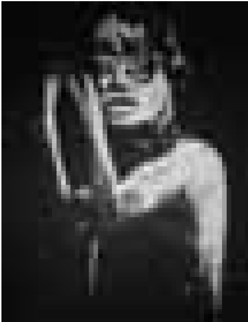
Les oeuvres exceptionnelles du peintre sud-africain Nelson Makamo seront à la Schungfabrik de Tétange du 5 au 13 juin.

„Mehr Interaktivität und eine 'alltagsgerechtere' Präsentation hätten der Ausstellung sicher gut getan.“ (Jörg Ahrens)