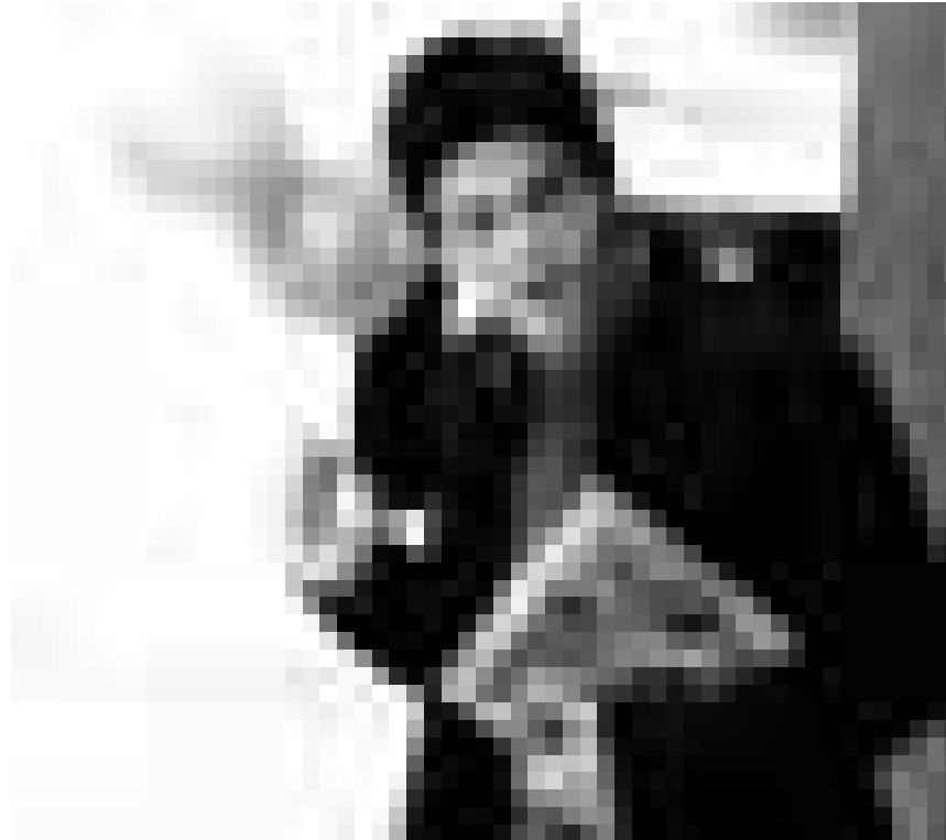
Autisme personnel contre autisme d'Etat : « My Name is Khan » raconte l'histoire d'un Pakistanais atteint du syndrome d'Asperger défiant la paranoïa sécuritaire américaine post-911, nouveau à l'Utopia.