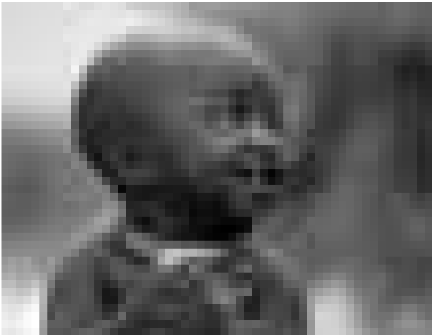
« Babies - Bébés », tout simplement : un film sur la première année de la vie de quatre enfants provenant de la Namibie, la Mongolie, le Japon et les Etats-Unis. Nouveau à l'Utopia.

Play by Dion Boucicault. Director Nicholas Hynter. With Simon Russell Beale and Fiona Shaw. 160' (inc. interval) (Engl. without st.) Live broadcast from National Theater London.