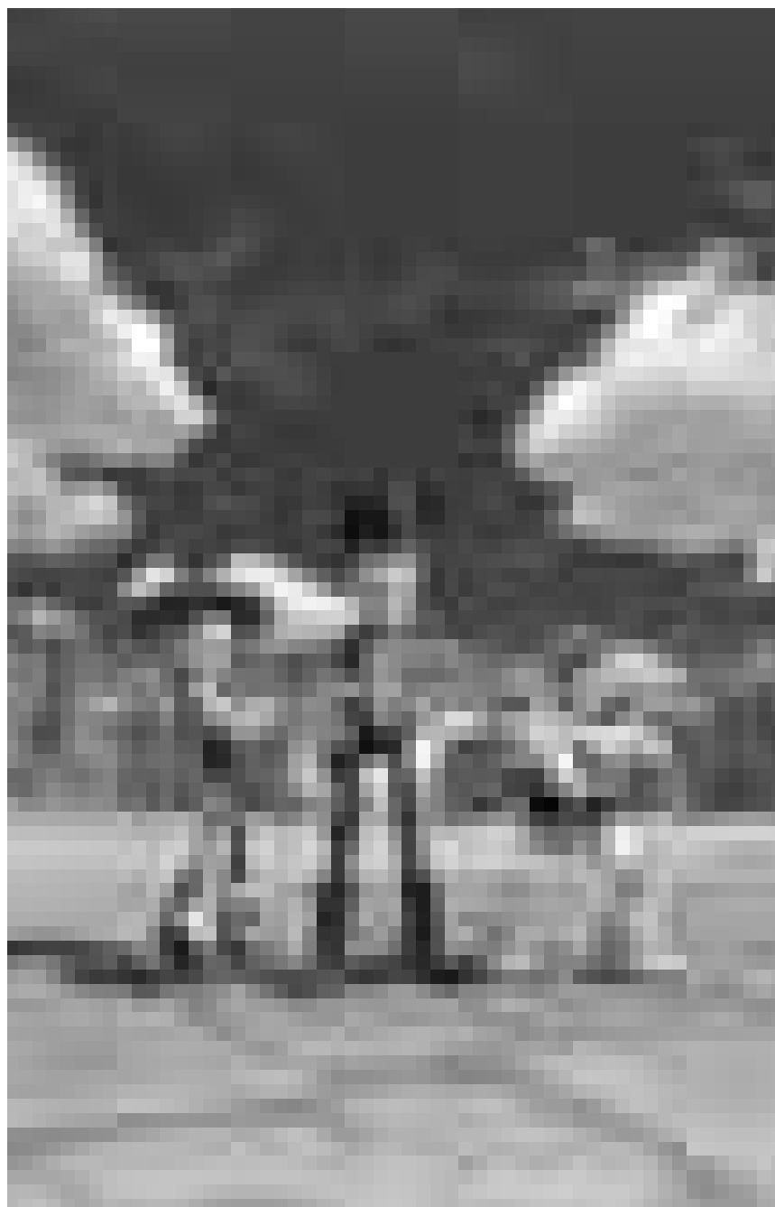
Lassen sich nicht ausrangieren: Die Spielzeugcharaktere aus „Toy Story 3“, unterhalten auch diesen Sommer die Massen. Neu, im Utopolis, Ariston und CinéBelval.