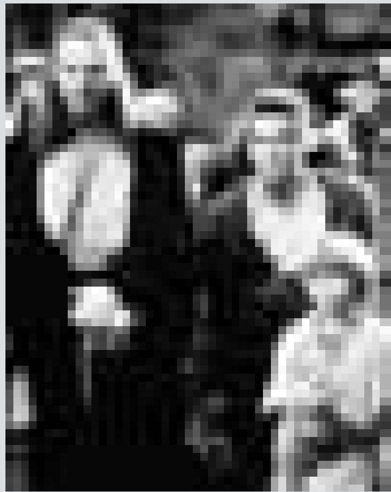
Rien de mieux qu'un petit rendez-vous avec Obi-Wan et ses collègues de Star Wars.

dans le patio du Théâtre des Capucins, jusqu'au 14 août, tous les vendredis et samedis à 22h. Entrée gratuite.