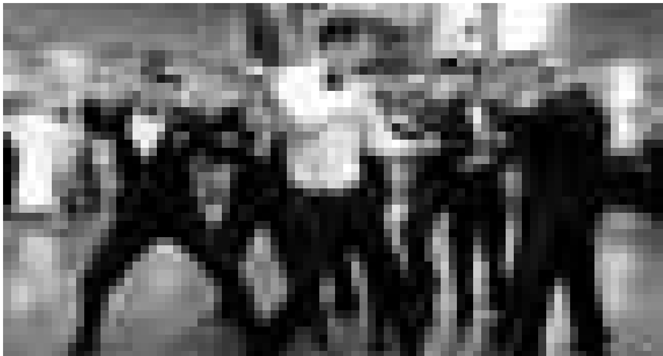
Und wiederum bekämpfen sich Tänzer im Wettbewerb. „Step Up 3“ von Jon M. Chu, neu im Utopolis und CinéBelval.