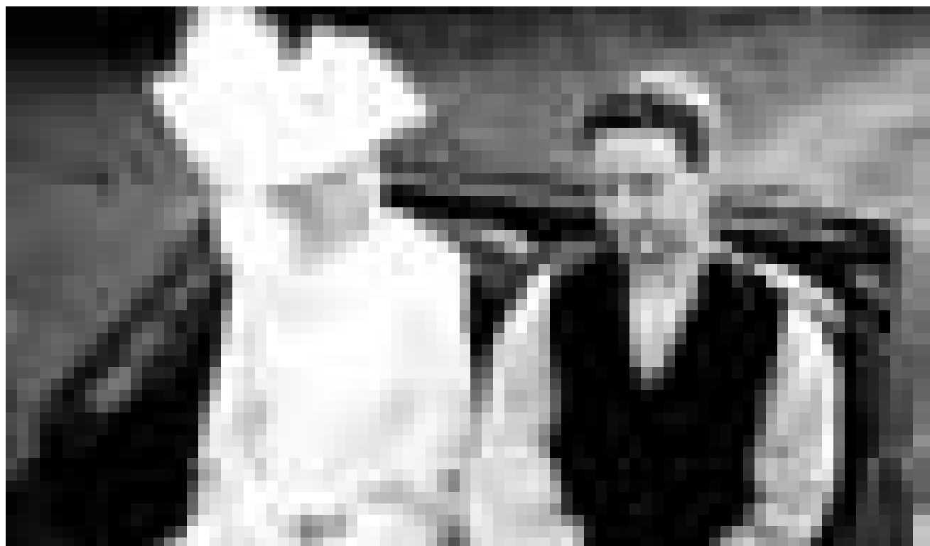
Ehefrau und Sekretär Tolstois streiten um das Recht auf des Schriftstellers Erbe. Helen Mirren und James McAvoy in „The Last Station“. Neu im Utopia.

Sonia est femme de ménage dans un hôtel. Guido est un ancien policier, qui travaille désormais comme gardien. Leurs chemins se croisent lors d'un