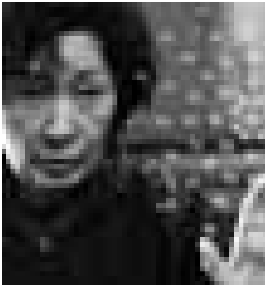
Ihr behinderter Sohn wird fälschlicherweise eines Mordes verdächtigt. Kim Hye-Ja in „Mother“. Neu im Utopia.