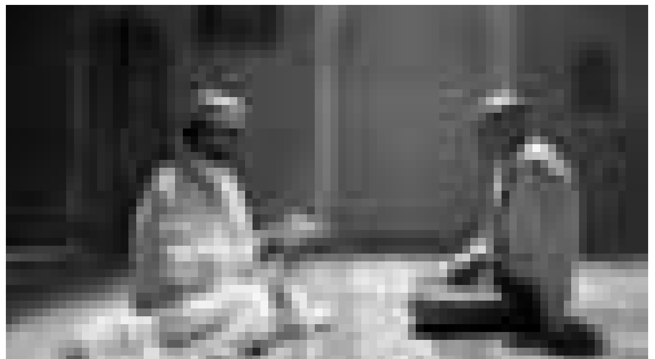
Un occidentalisé a promis à son père malade de faire le ramadan à sa place. Karim Belkhadra et Kad Merad dans « L'italien ». Nouveau à l'Utopolis.

Andy ist mittlerweile ein Teenager und packt seine Sachen fürs College ein. Da ist kein Platz mehr für Cowboys, Space-Ranger oder Dinosaurier. Für