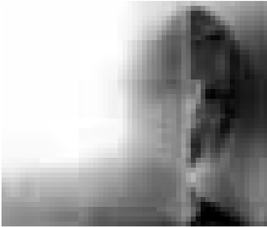
Une relation entamée lors d'un speed-dating peut finir mal. Kseniya Rappoport dans « La doppia ora ». Nouveau à l'Utopia.