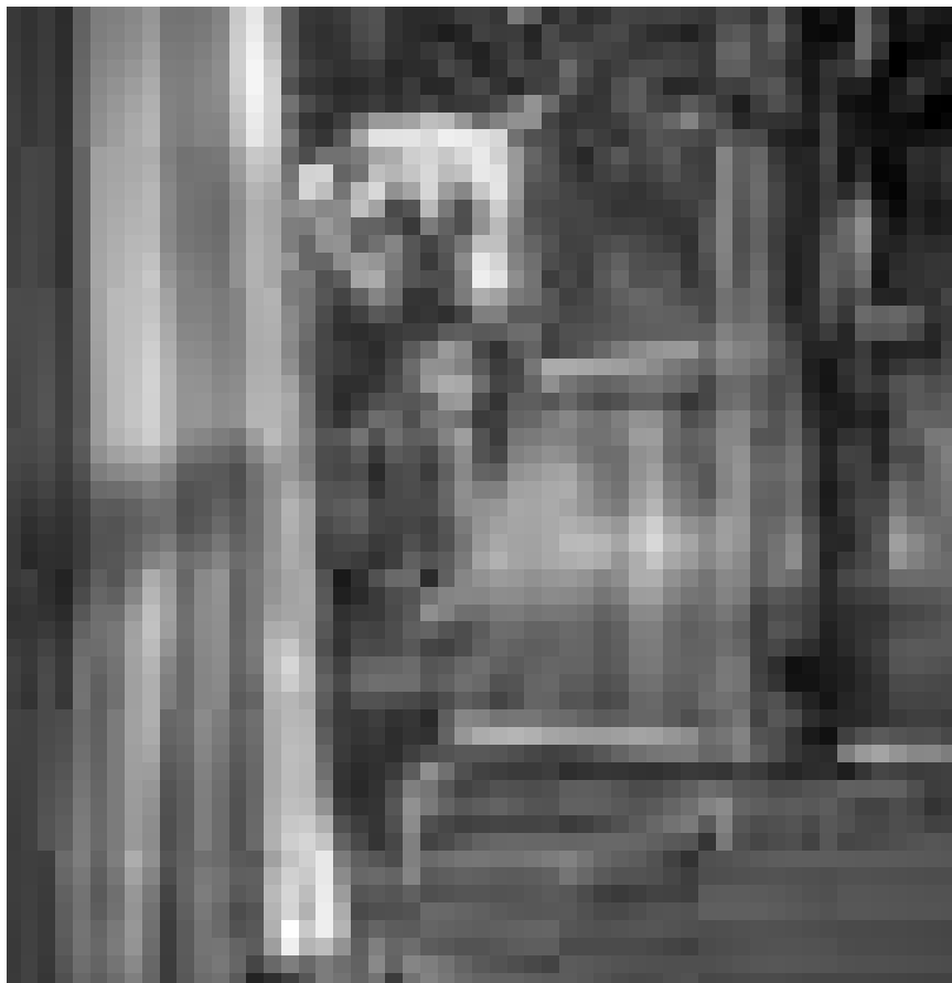
Sprechende Tiere in einem Hollywood-Film. „Cats & Dogs: The Revenge of Kitty Galore“. Neu im Utopolis, CinéBelval und Sura.

Woody und seine Freunde ist damit der Tag gekommen vor dem sie immer Angst hatten: Sie werden nicht mehr gebraucht ... denken sie zunächst!