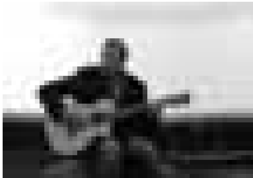
Klingt gut: der Songwriter Götz Widmann. Am 27. August auf der Sommerbühne des Trierer Exhauses.

Endlich Zeit zum woxx lesen , auch das Kleingedruckte, im Sommerloch, Balkonien , 11h - 18h.