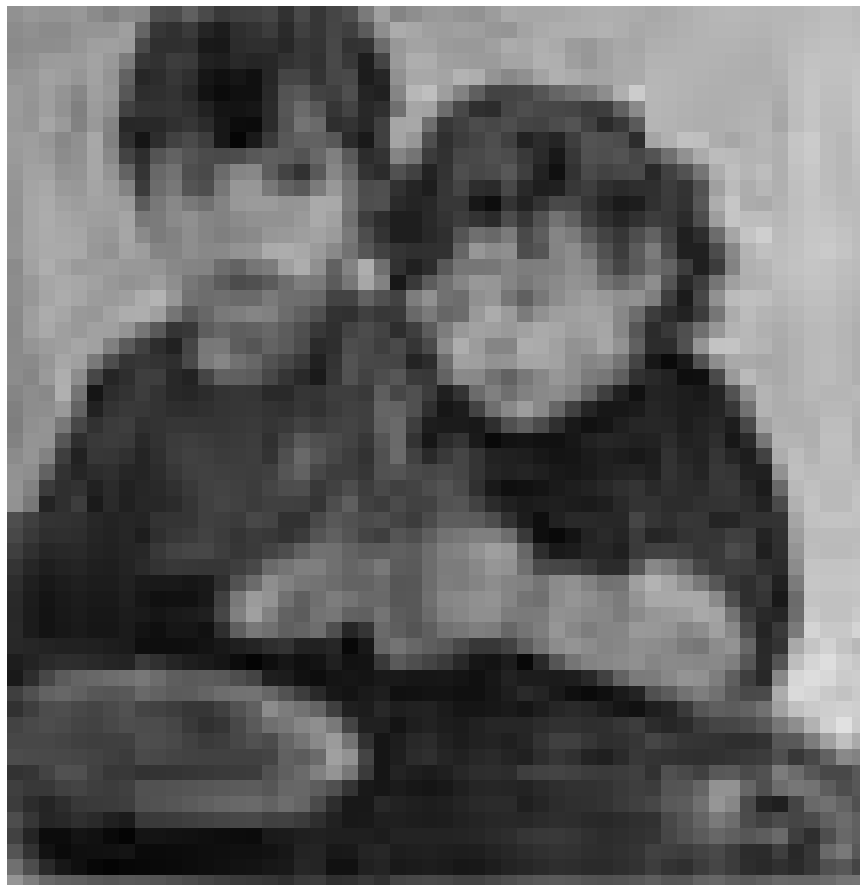
Le château de Bourglinster ouvrira ses portes aux peintures et sculptures de Pia et Paul Ranslet, à partir du 17 septembre.