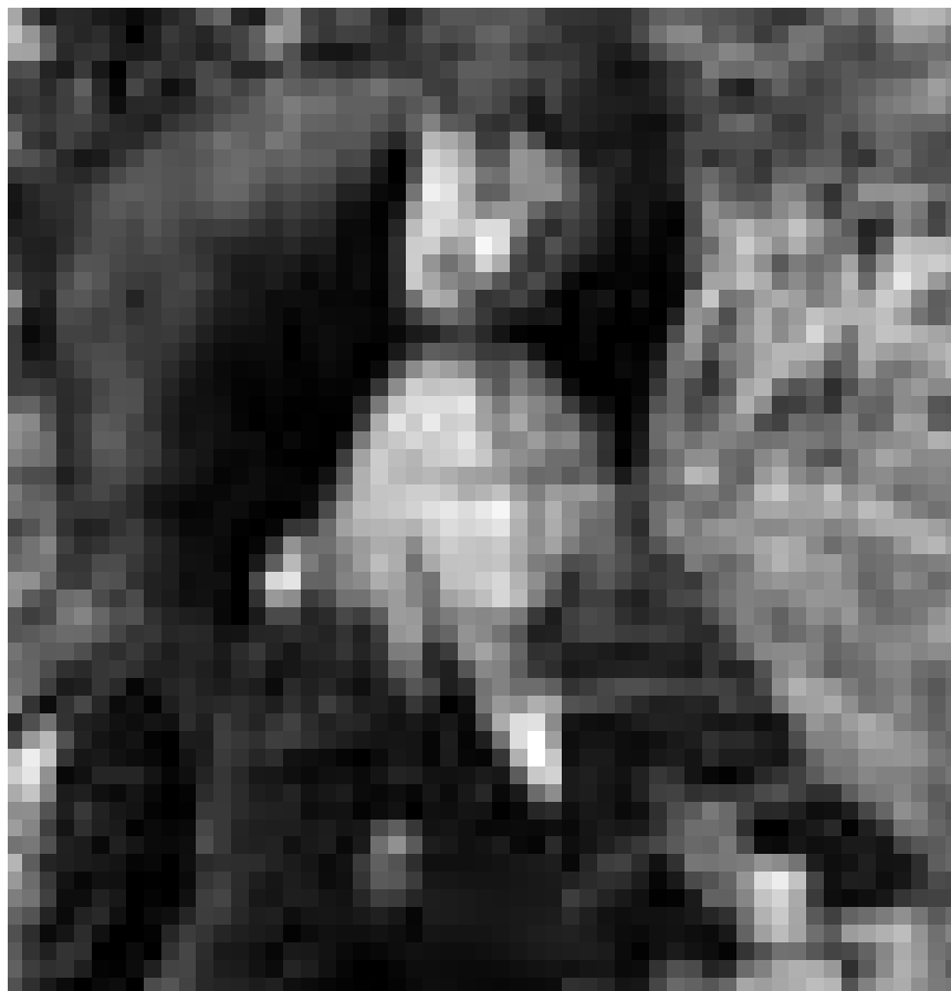
Se retrouve dans les mailles du filet criminel : Daniel Auteuil dans « Donnant Donnant », nouveau à l'Utopia.

Dans le monde, plus d'un milliard de personnes vivent dans des bidonvilles. A Kibera, dans la capitale kenyane de Nairobi, plus d'un million de personnes survivent. Ce bidonville est le plus grand d'Afrique. Le film raconte les histoires de ses habitants et montre leur courage remarquable face à l'extrême pauvreté.