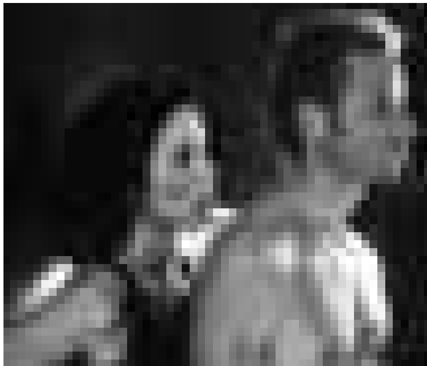
Un film sur la perte de la mémoire et la volonté d'en finir avec le passé : « Memento », de Christopher Nolan, vendredi à la Cinémathèque.

Un jeune compositeur se fait voler sa musique, jeter en prison et défigurer par le producteur malhonnête, Swan, propriétaire du Paradis. Il en devient le fantôme, tentant de protéger une jeune chanteuse des griffes de Swan.