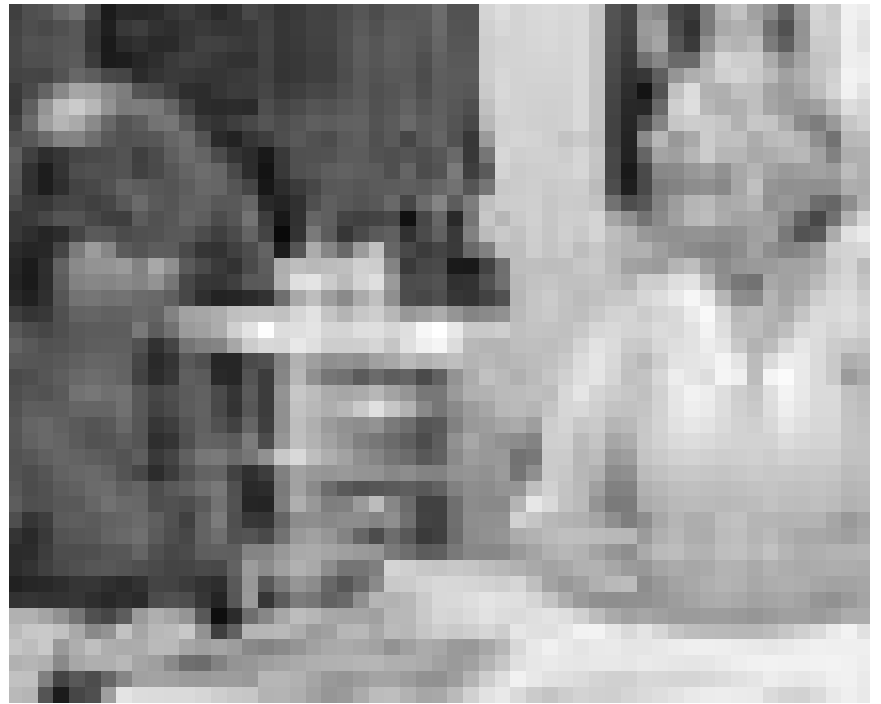
Sieht nach Rentnerfilm aus, ist aber der neue Woody Allen: „You Will Meet A Tall Dark Stranger“, neu im Utopia.