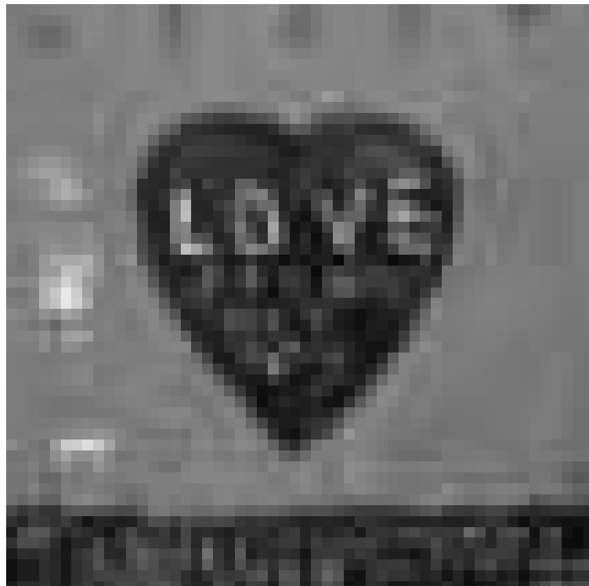
Hat was für uns Luxemburger übrig : Troy Henriksen „Something for Luxembourg“ - ab dem 26. Oktober, in der Galerie Miltgen, Luxembourg-Stadt

NEW Casino Luxembourg - Forum d'art contemporain (41, rue Notre-Dame, tél. 22 50 45), du 30.10 au