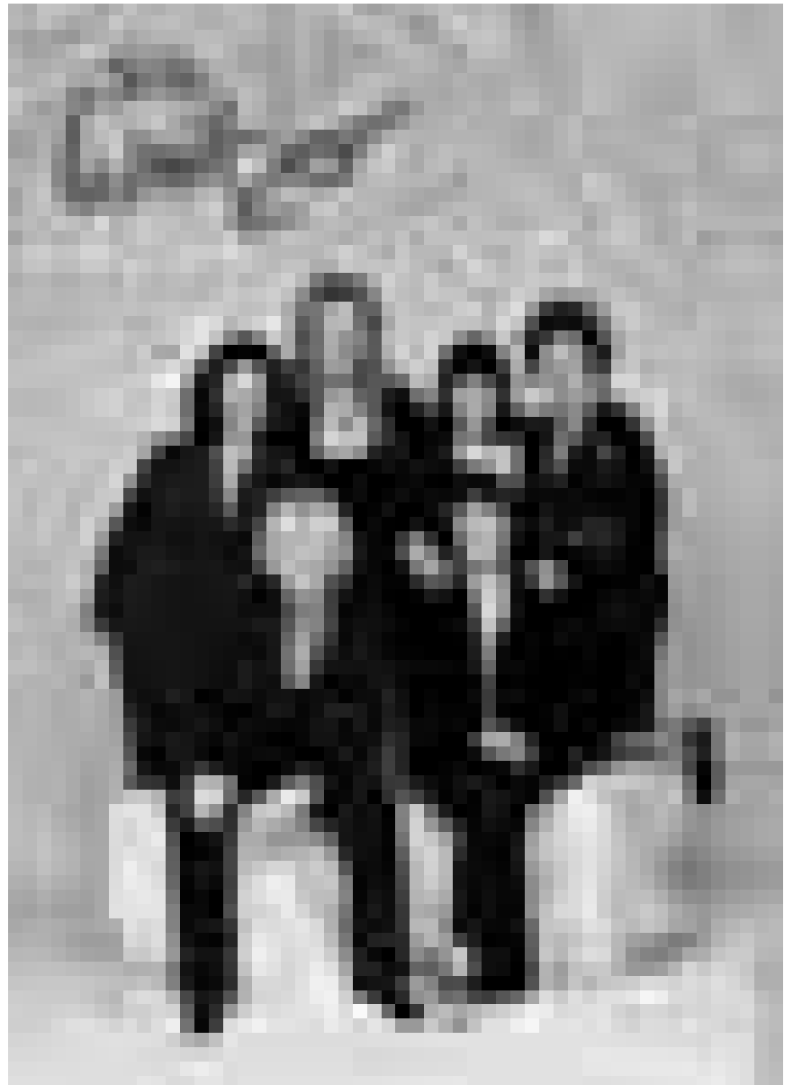
Erfüllen die Frauenquote zu 100 Prozent : „Weiber Reloaded“ - Comedy-Musical am 22., 23. und 24. Oktober im Marnacher Cube 521.