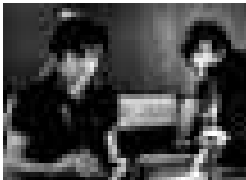
La pop belge est toujours vivante et indivisée : The Tellers, le 29 octobre à l'Exit07.

2. Sinfoniekonzert , Werke von Beethoven, Weber und Brahms,