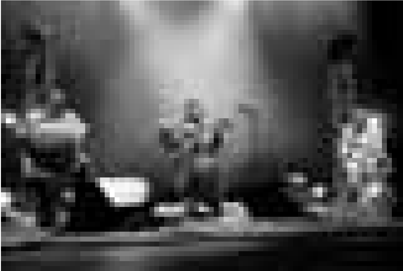
Le monde a rendez-vous à Arlon : 3MA, à la Maison de la Culture, le 30 octobre.

Theater, Trier (D) , 20h. Tel. 0049 651 7 18 18 18.