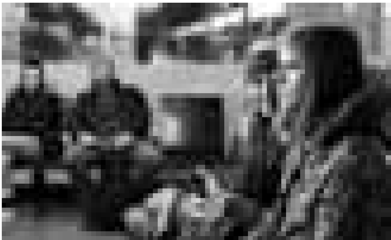
Rencontre insolite mais fructueuse : « No et moi », de Zabou Breitman, nouveau à l'Utopia.