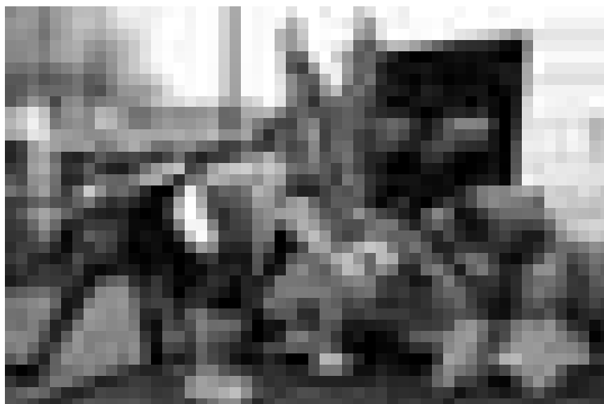
Wenn der Terrorist zum absoluten Kracher wird: „Four Lions“ - Satire auf die allgegenwärtige Terrorangstmache, neu im Utopia.