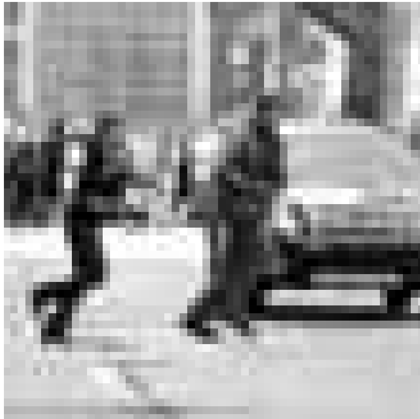
Amerikanischer Nachdreh eines französischen Vorbilds: „The Next Three Days“ - beschäftigt sich mit der Schuldfrage und der Liebe, neu im Utopolis und im CinéBelval.

XXX Une comédie pleine de noirceur où les protagonistes s'agrippent à leurs illusions comme à des tiges de bambou dans le marécage de la vie. (dv)