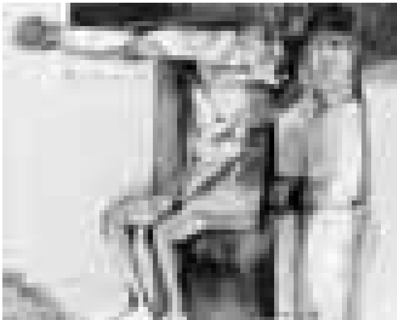
Noch bis zum 15. Januar erfreut die hauptstädtische Galerie Simoncini KunstliebhaberInnen mit Gemälden von Guy Michels.

installation, Musée d'Art Moderne Grand-Duc Jean (Park Dräi Eechelen, tél. 45 37 85-1), jusqu'au 22.5.2011, lu., je. - di. 11h - 18h, me. nocturne jusqu'à 20h.