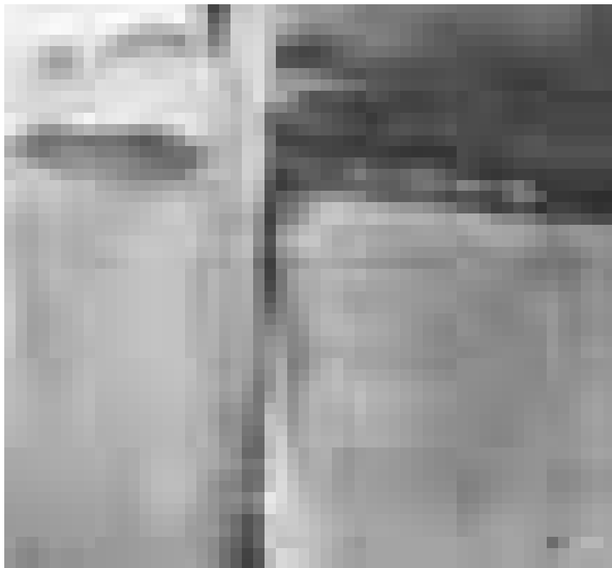
...qui se marient excellentement aux aquarelles de Rainer Tappeser. Vernissage le 11 janvier.

angemessen würdigen zu können.“ (Jörg Ahrens)