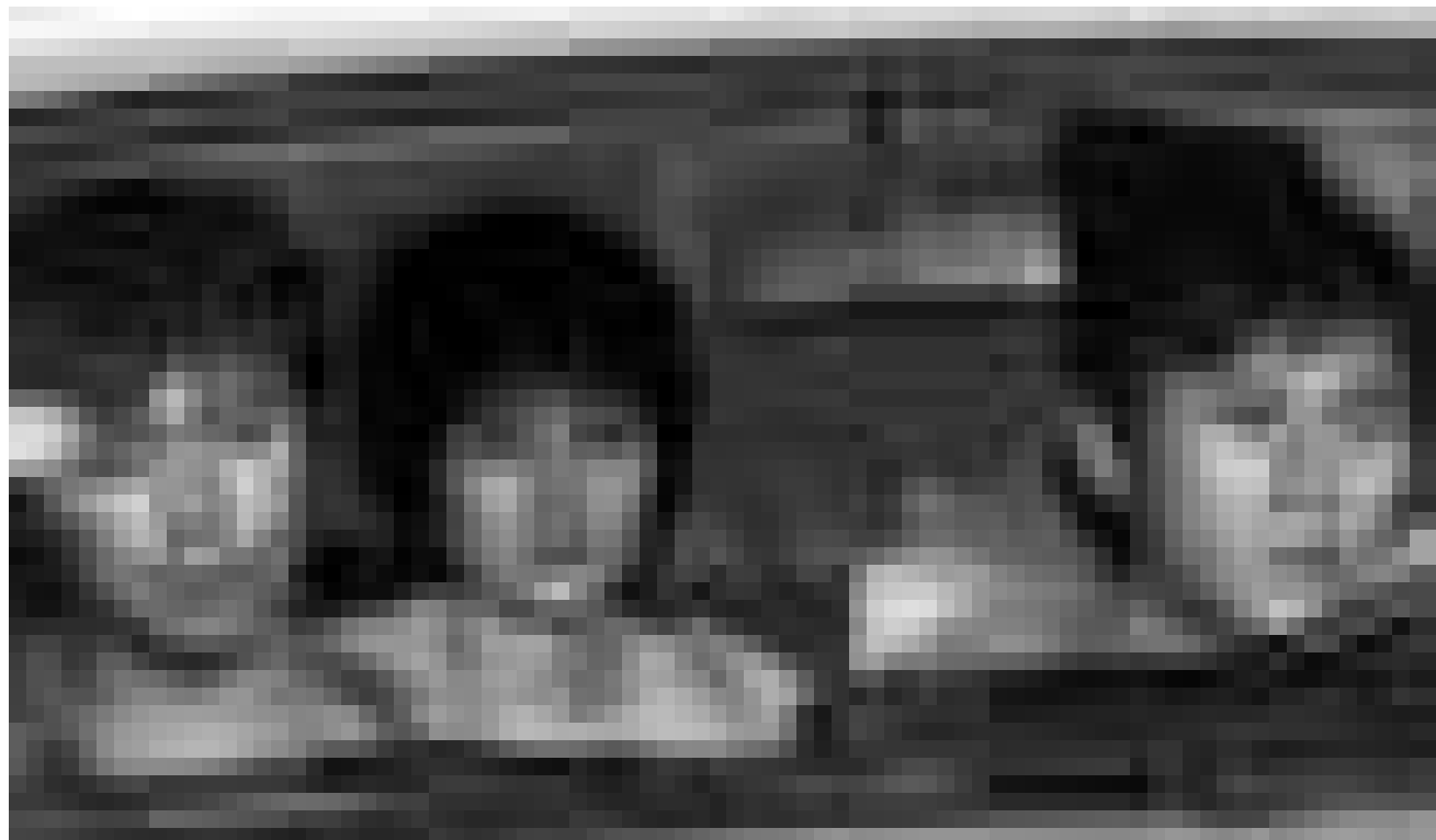
Le triangle amoureux en version chinoise : « Nuits d'ivresse printanières », Cinédit à l'Utopia mercredi et jeudi.

A Nankin, la femme de Wang Ping le soupçonne d'infidélité. Elle engage Luo Haitao pour l'espionner et découvre ainsi l'amour que son mari porte à un homme, Jiang Cheng. Avec lui Luo Haitao et sa petite amie, se jettent à corps perdu dans une folle équipée amoureuse. Un sulfureux voyage aux confins de la jalousie et de l'obsession amoureuse.