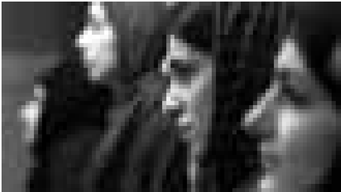
Integration mal von der anderen Seite gesehen: „Shahada“ erzählt die Geschichten von drei jungen Muslimen in Deutschland. Neu im Utopia.