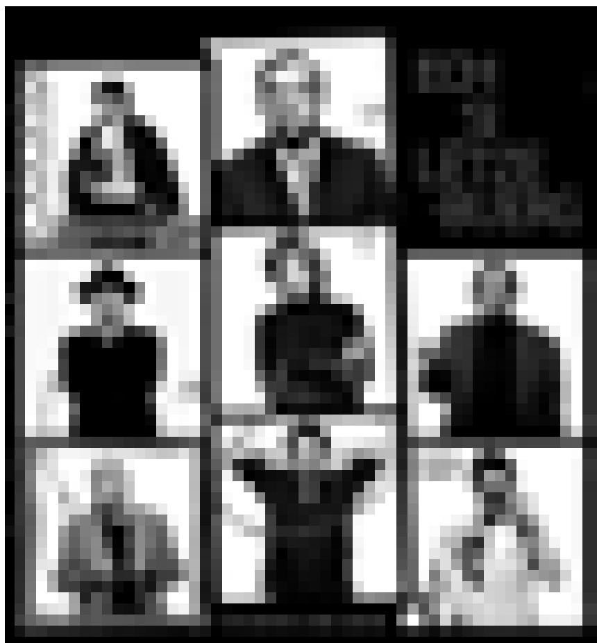
„Ech si Lëtzebuerg“ - a mir duechten dat wier just den Här uewen an der Mëtt ... D'Fotoen vun Yves Kortum a Marc Laroche sinn nach bis den 1. Mäerz am Espace H2O ze gesinn.