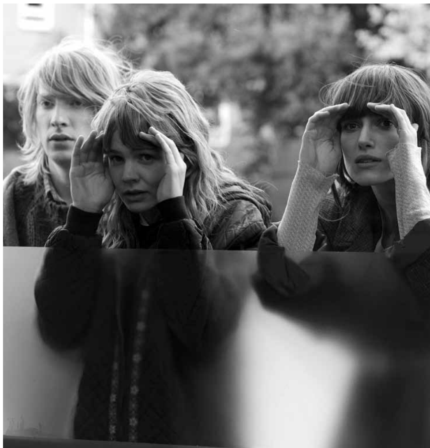
Da ist was faul im Staate Britannien: „Never Let Me Go“, neu im Utopia.

Propulsé à la tête du groupe W après le décès de son père adoptif, Largo Winch décide, de mettre le groupe en vente afin de créer une fondation humanitaire. Mais soudain il se retrouve accusé de crimes contre l'humanité par un mystérieux témoin. Pour prouver son innocence, Largo va retourner sur les traces de sa vie passée, au coeur de la jungle birmane. *** Trop compliqué pour être un film d'action pur et dur et pas assez profond pour devenir un classique. (lc)