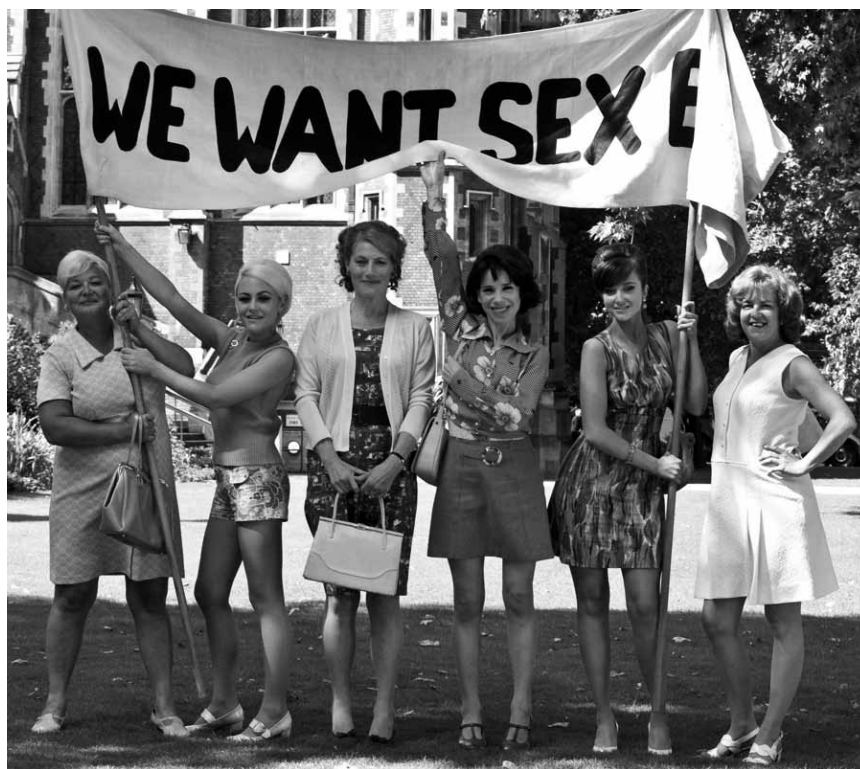
Sie wollen keinen Sex, sondern gleiche Löhne und Respekt: Pünktlich zum Weltfrauentag kommt „Made in Dagenham - We want Sex Equality“ in die Kinos. Neu im Utopia.

1953, sur fond de coup d'état iranien orchestré par la CIA, le destin de quatre femmes converge vers un magnifique verger synonyme pour elles d'indépendance, de réconfort et d'amitié.