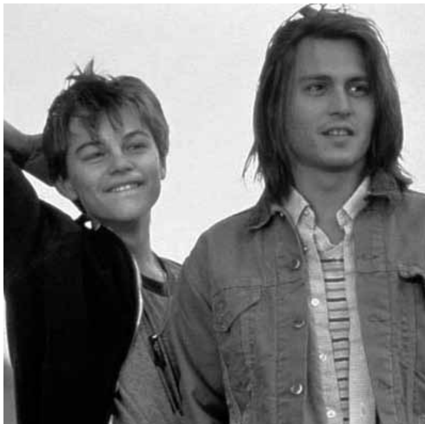
Une épopée américaine, mise en scène par Lasse Hallström : « What's Eating Gilbert Grape ? », samedi à la Cinémathèque.