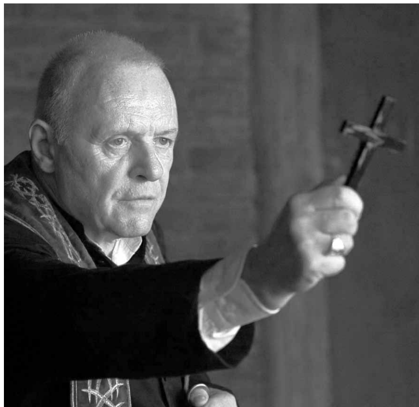
Vom Menschenfresser zum Exorzisten: Anthony Hopkins bleibt seinen Rollen treu. „The Rite“, neu im Utopolis.

In den Wäldern der Ozark Mountains ist die Welt ganz anders. Die siebzehnjährige Ree sucht verzweifelt ihren Vater, der untergetaucht ist und das Haus der Familie verpfändet hat. Wenn sie ihn nicht auftreiben kann, wird sie mit ihren kleinen Geschwistern und der kranken Mutter auf der Straße stehen. Article page 12.