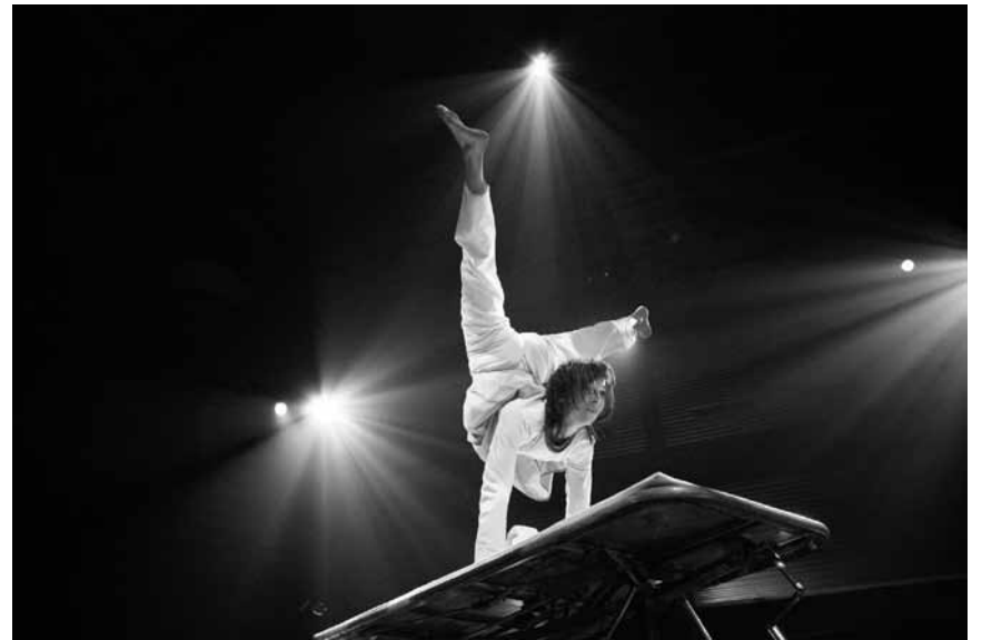
« La vie » est aussi faite pour danser : spectacle de la compagnie « Les 7 doigts de la main », les 18 et 19 mars à la Maison de la culture arlonaise.

Creatures of Habit , jazz, Brasserie Le Neumünster (Centre culturel de rencontre Abbaye de Neumünster), Luxembourg, 11h30. Tél. 26 20 52 981.