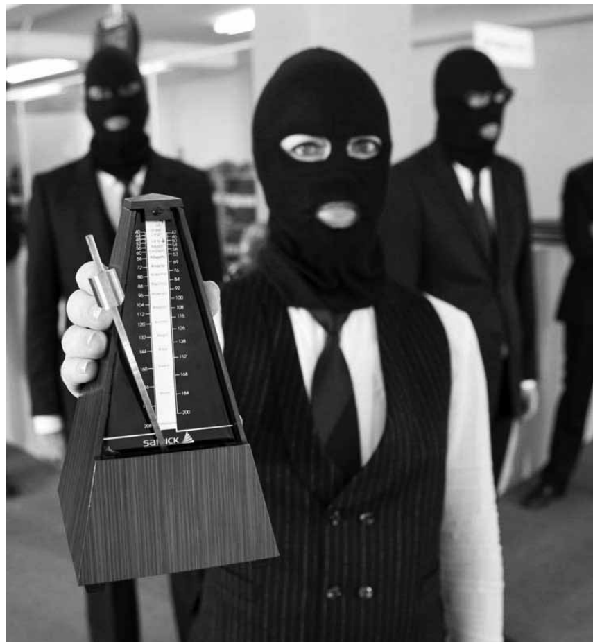
Wenn Musik zum Terror wird, ist die Sache ernst : „Sound of Noise“, neu im Utopia.