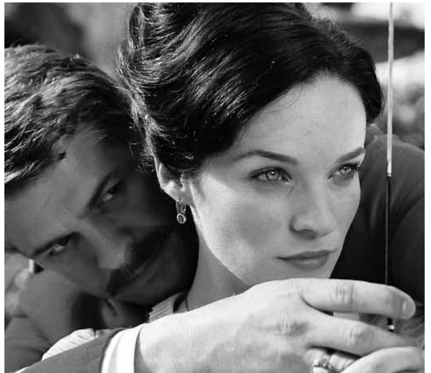
Le romantisme portugais est à l'honneur dans « O Misterio da Estrada de Sintra », mardi à l'Utopia, dans le cadre du « Festival du Film portugais ».