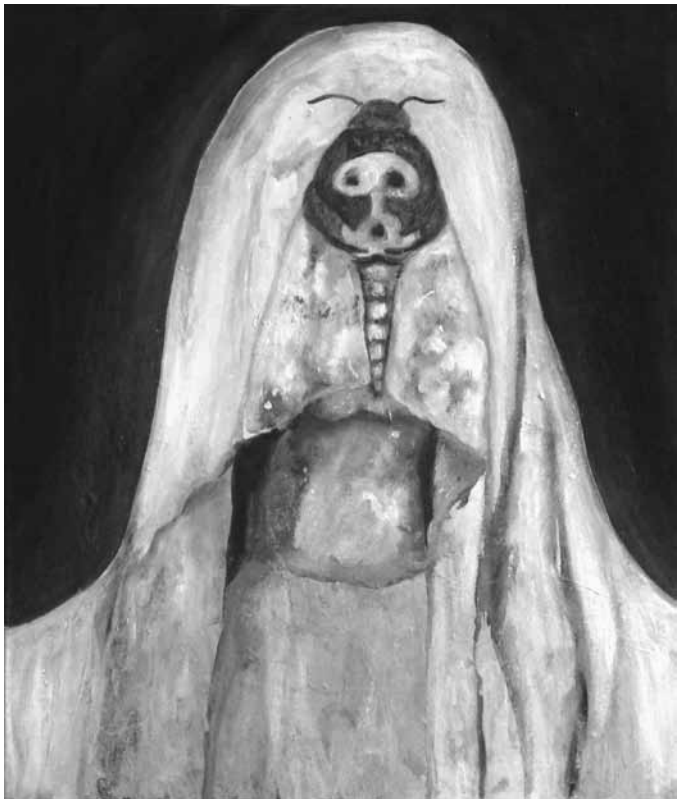
M. NOZAHIC: LE MASQUE