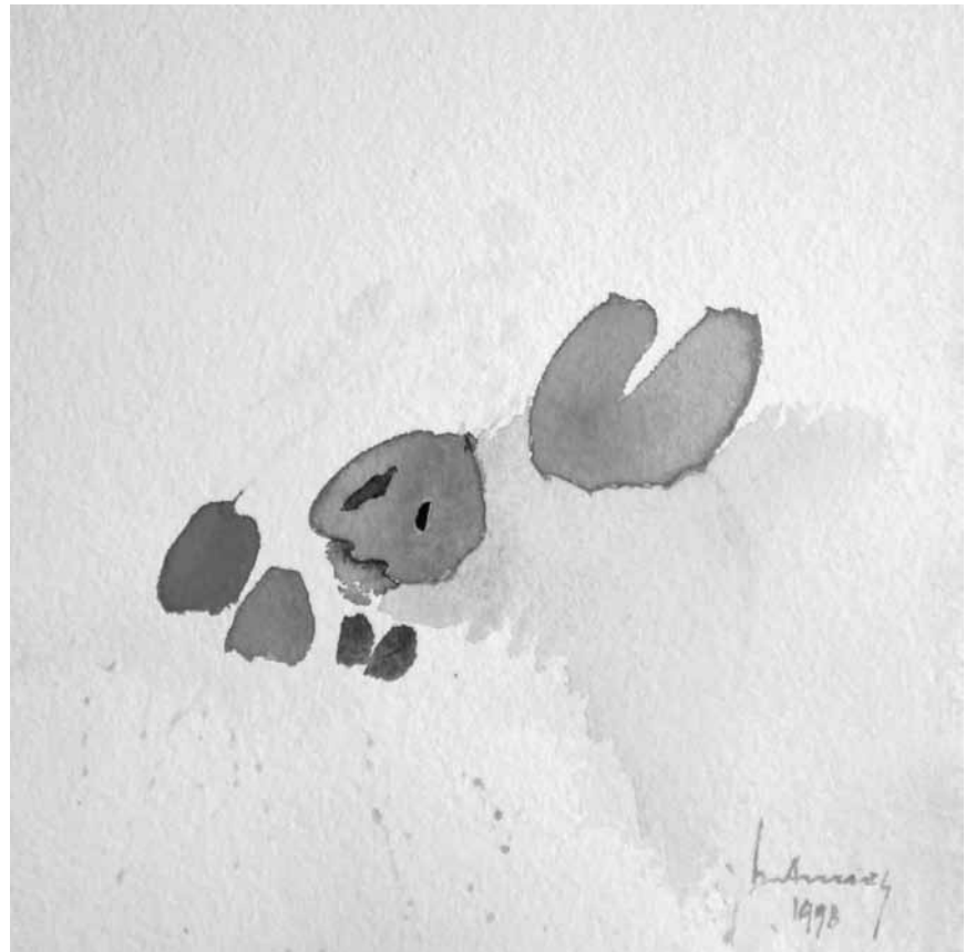
A partir du 29 mars la galerie Médiart à Luxembourg-Ville rend hommage à Roger Bertemes, décédé en 2006.