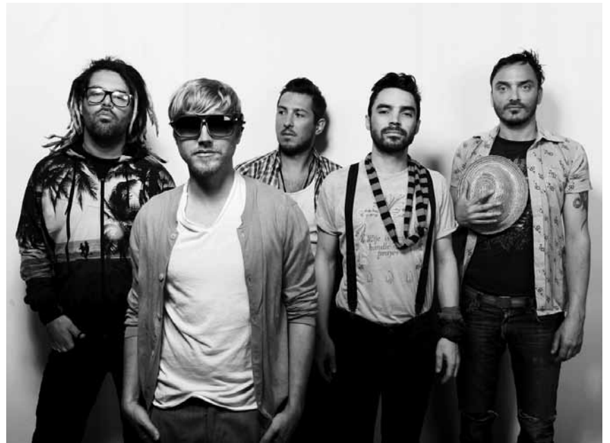
Qui a dit que le rock français était mort ? Empyr viennent prouver le contraire, ce vendredi 25 mars aux Trinitaires à Metz.