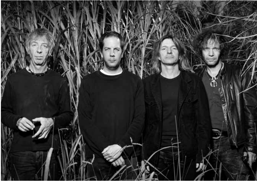
Les seigneurs des sampleurs : The Young Gods.