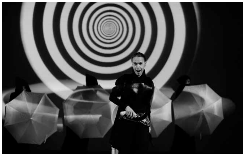
Mord, Sex, Eifersucht und Händels Musik: „Ariodante“ wird am 2. April im Cape Ettelbrück aufgeführt.

Intolerance, projection du film muet de David Wark Griffith, animation musicale par l'Orchestre Philharmonique du Luxembourg sous la direction de Carl Davis, Philharmonie, Grand Auditorium, Luxembourg , 20h. Tél. 26 32 26 32.