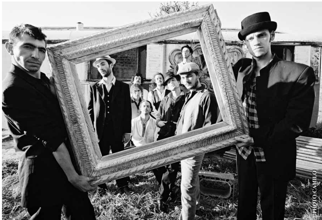
Bien encadrés : le groupe français de ska reggae rock « Babylon Circus » fait partie de la programmation des Aralunaires et sera présent le 23 avril sur la Grande Place d'Arlon.

Mixhell , avec Renaissance Man, Gesaffelstien, Bad Dancer et The Crime, Hall polyvalent, Arlon (B), 20h. Dans le cadre des Aralunaires. www.aralunaires.be