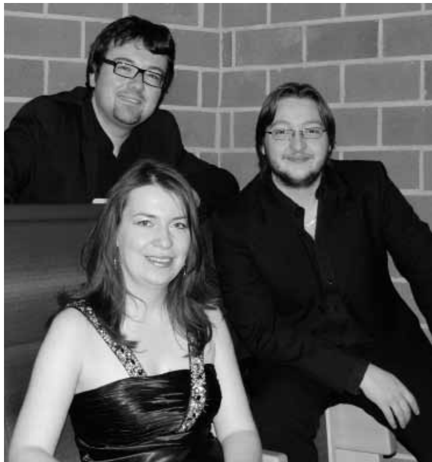
Beethoven, Glinka, Fauré und Bruch stehen auf dem Programm von „Claritmico“. Am 17. April im Rahmen der „Musek am Syrdall“ im Kulturhaus in Niederanven.

Chief Marts + Sermeq + Z Town Massiv + DJ Keta , Café-Théâtre Rocas (place des Bains), Luxembourg, 21h. Tél. 27 47 86 20.