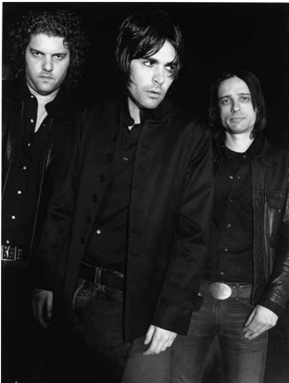
Célèbre le blues de l'homme blanc : Jon Spencer et sa Blues Explosion.