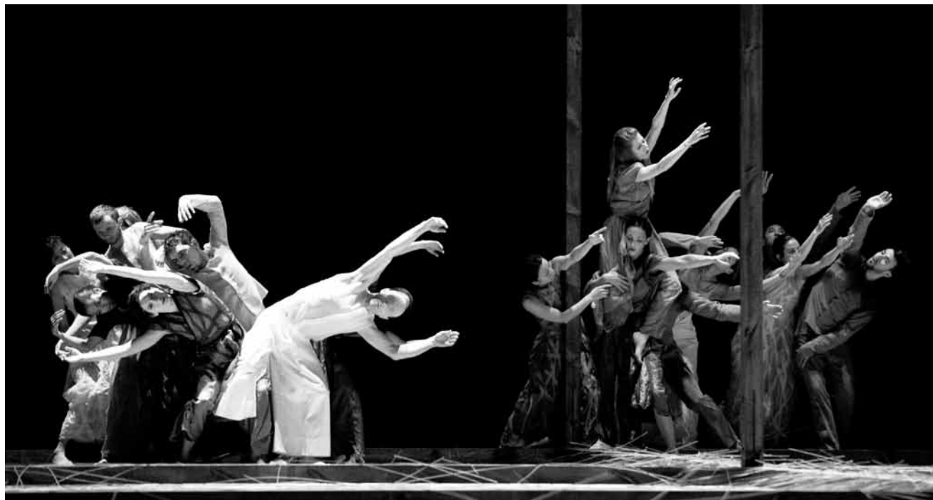
Zwei Geisterschwestern, gebrochene Herzen und viel Bewegung : „Matsukaze“ ist eines der bekanntesten Dramen des japanischen „No“-Theaters und wird - nach einer Choreografie von Sasha Waltz - am 9. und am 10. Juni im Grand Théâtre aufgeführt.

La coscienza di Zeno, d'Italo Svevo, Salle Robert Krieps au Centre culturel