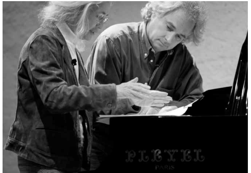
Sont partis avec Franz : l'actrice Brigitte Fossey et le pianiste Yves Henry montreront leur spectacle : « Liszt, le voyageur idéal », ce 5 juin à la Philharmonie.