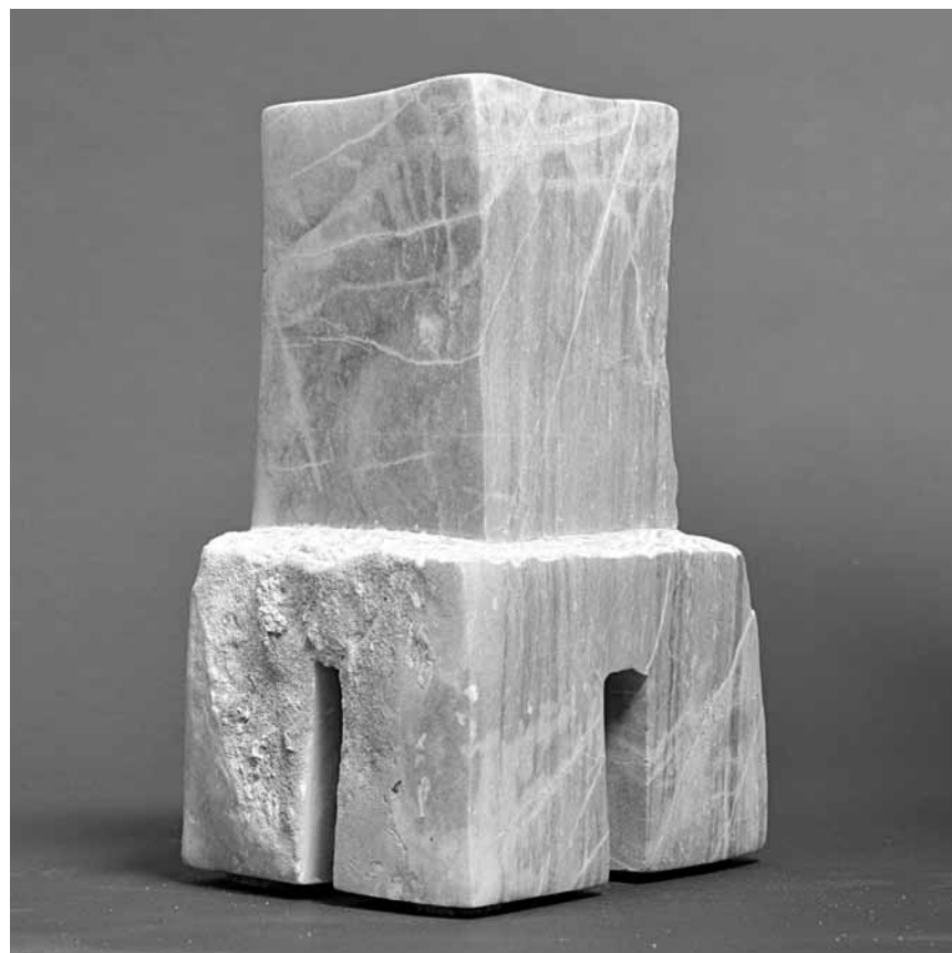
Große Blöcke = Große Kunst? Finden Sie es raus im Espace Médiart wo Bertrand Ney seine Skulpturen zusammen mit Gabriel Belgeonnes Aquarellen ausstellt, bis zum 6. Juli.

peintures, Galerie Miltgen (32, rue Beaumont, tél. 26 26 20 20),