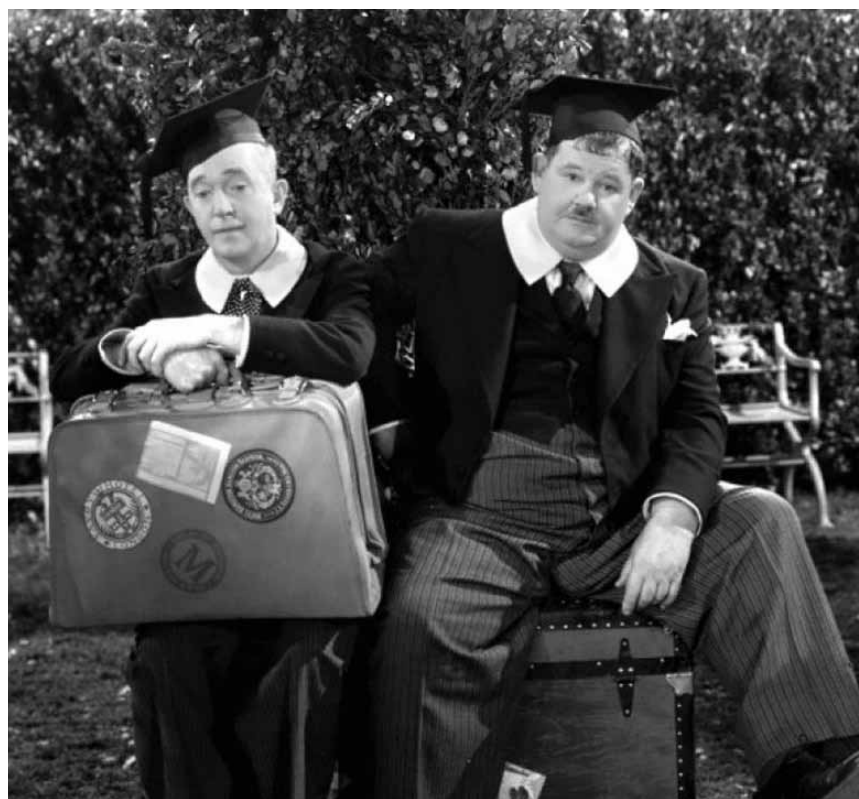
Wollen ganz hoch hinaus: Stan und Laurel in „A Chump at Oxford“, am Sonntag in der Cinémathèque.

Die Sitzungen mit dem redegewandten und schlauen Häftling, Totschläger und Brandstifter Gerald „Stone“ Creeson, sind nicht gerade das, was man sich als Bewährungsbeamter kurz vor der Pensionierung wünschen würde. Für Jack Mabry wird der Fall zu einer letzten großen Prüfung, denn Stone setzt alle Hebel in Bewegung, um seine vorzeitige Entlassung zu erreichen. ❌ Irrationale Elemente machen den Film, trotz einiger Längen, interessant. (cw)