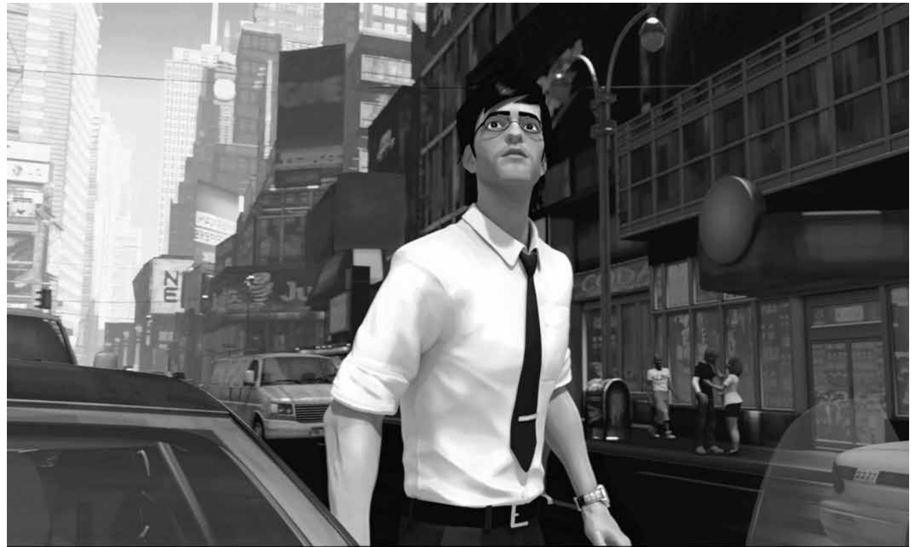
Jimbo a des talents aussi extraordinaires que dangereux : « The Prodiges - La nuit des enfants rois », nouveau à l'Utopolis.

Zenturio Marcus reist ins Feindesland Britannien, um nach seinem Vater, dessen Legion und einem bedeutenden Feldzeichen zu suchen. Mit seinem Sklaven Esca begibt er sich in den britischen Norden, in der Hoffnung, nicht ins Visier der Pikten zu geraten. Bald stellt sich jedoch heraus, dass Esca eine ganz eigene Agenda verfolgt.