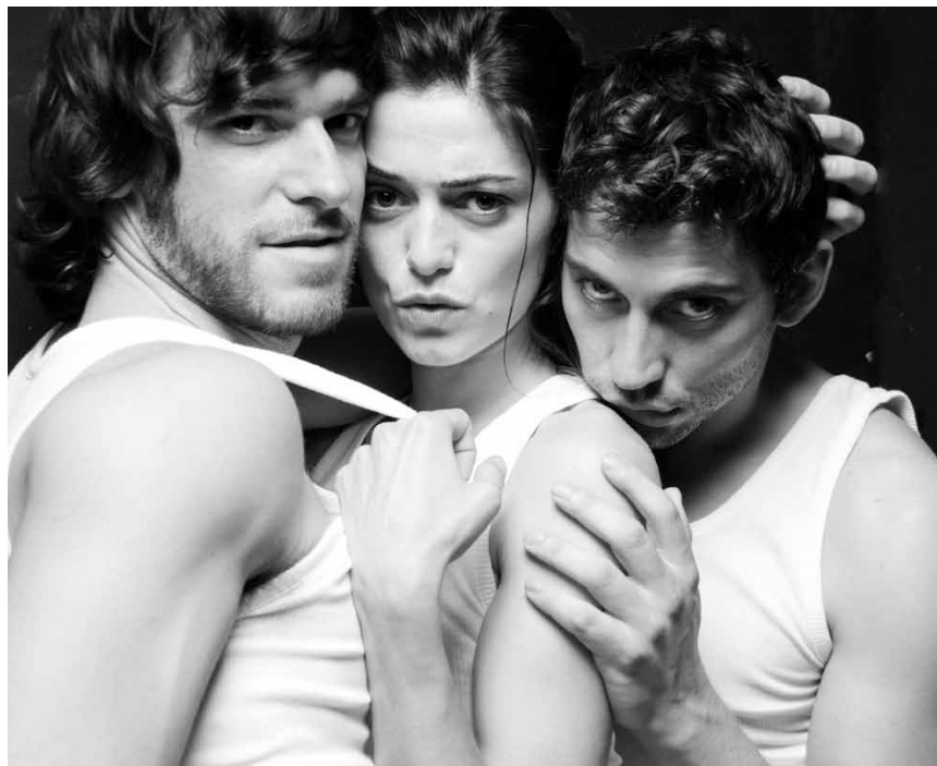
Une cuisinière entre deux hommes... « Dietas Mediterránea », dans le cadre du « Festival du Film Espagnol », à l'Utopia.