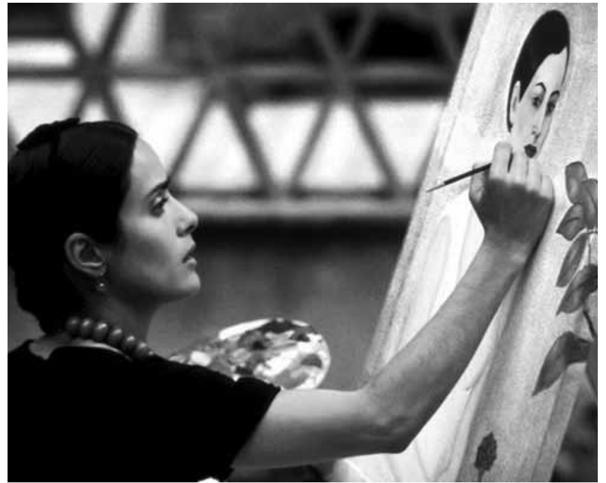
« Frida » est plus qu'une icône révolutionnaire : Salma Hayek dans la biographie de la peintre surréaliste controversée, mercredi à la Cinémathèque.