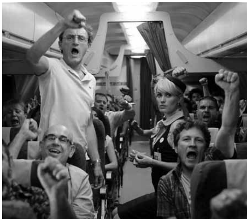
Victimes de leur propre avarice : les passagers de « Low Cast », nouveau à l'Utopolis.