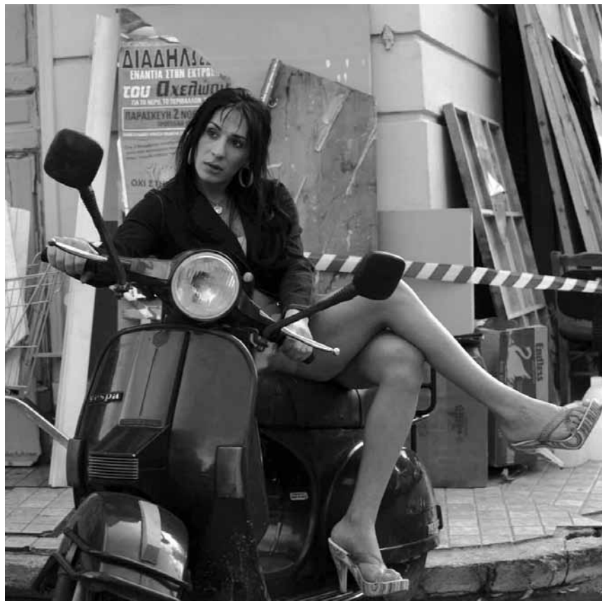
Strella va sauver Yiorgos de la galère après 14 ans de prison : « Strella », à l'Utopia dans le cadre du « CinéClub Hellénique ».

Edward Collins, ein reicher Erbe, will nicht nur seines Geldes wegen geliebt werden. Als er die Kellnerin Ninette kennenlernt, gibt er vor bettelarm zu sein. Sie besorgt ihm einen Arbeitsplatz. Edward rettet sich gezwunge-