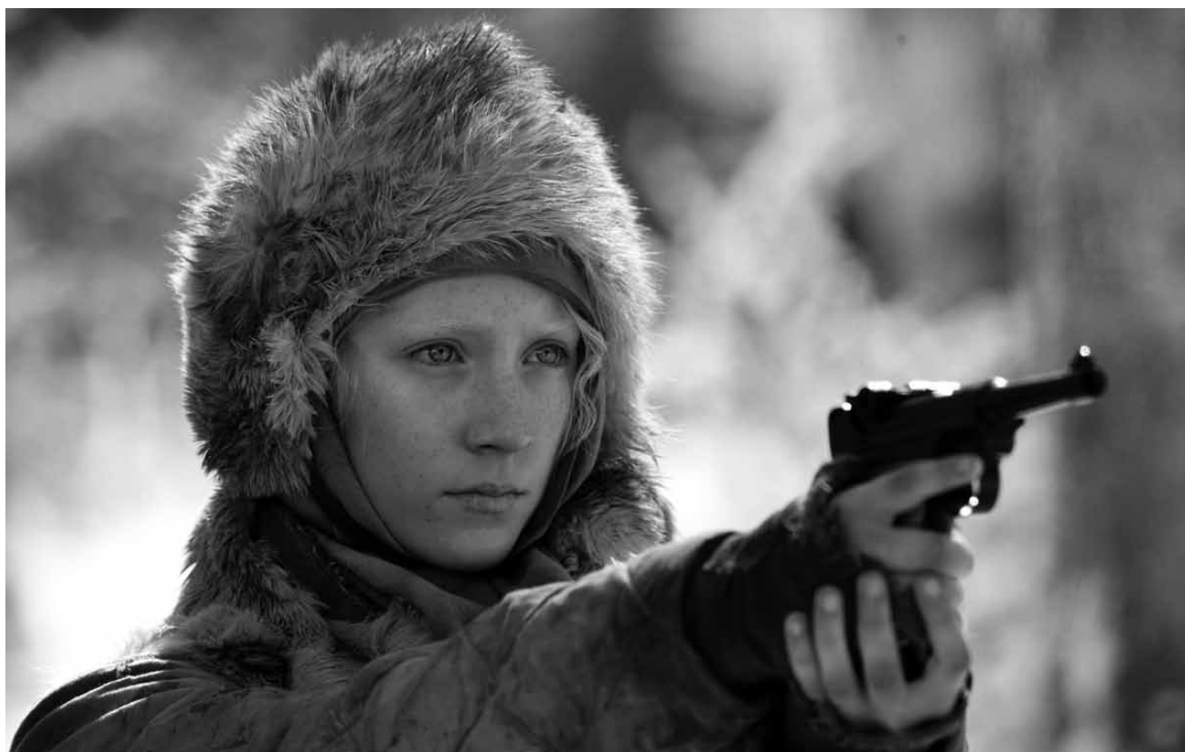
Blondes Gift geht wohl nie aus : Die zur Killermaschine gedrehte „Hanna“ greift so richtig durch, neu im Utopolis.