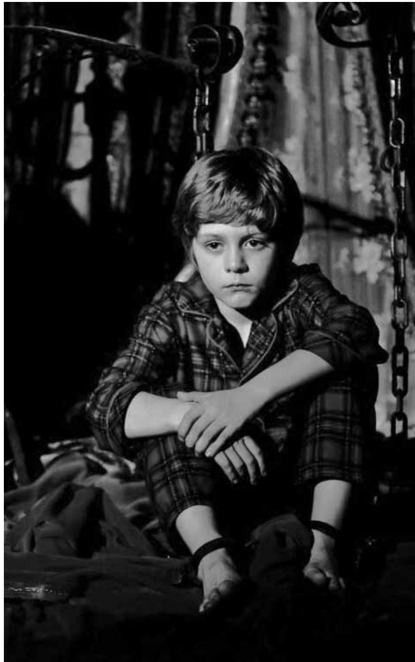
Ob er auch tote Menschen sieht? „Insidious“ scheint sämtliche Zutaten für einen amerikanischen Horrorklassiker zu beinhalten, neu im Utopolis.

Bevor ihre Allianz zerbricht und sie zu Feinden werden, sind Professor X und Magneto enge Freunde. Mit ihren Mutanten-Kräften versuchen sie in den 1960ern, den Lauf einer Welt zu korrigieren, die wegen der Kuba-Krise ins Chaos zu entgleisen droht. Sie gründen eine geheime Privatschule für Mutanten.