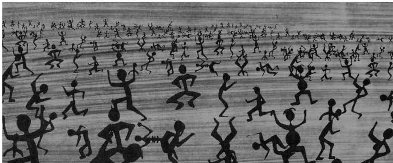
Das Kollektiv „Schläifmillen“ geht auf Wanderung und stellt noch bis zum 31. Juli im Wiltzer Schloss aus. Nebenbei feiern die KünstlerInnen ihr alljährliches Fest am 2. und am 3. Juli in ihren Ateliers in der Schläifmillen.

Mierscher Kulturhaus (53, rue Grand-Duchesse Charlotte, tél. 26 32 43-1), jusqu'au 14.7, lu. - ve. 14h - 18h et sur rendez-vous.