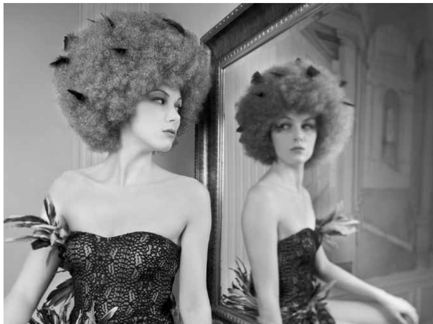
Un flair de bohème flotte dans l'ancienne laiterie « La Celula » à Bettembourg, où la photographe Martine Pinnel expose à partir du 1er juillet.