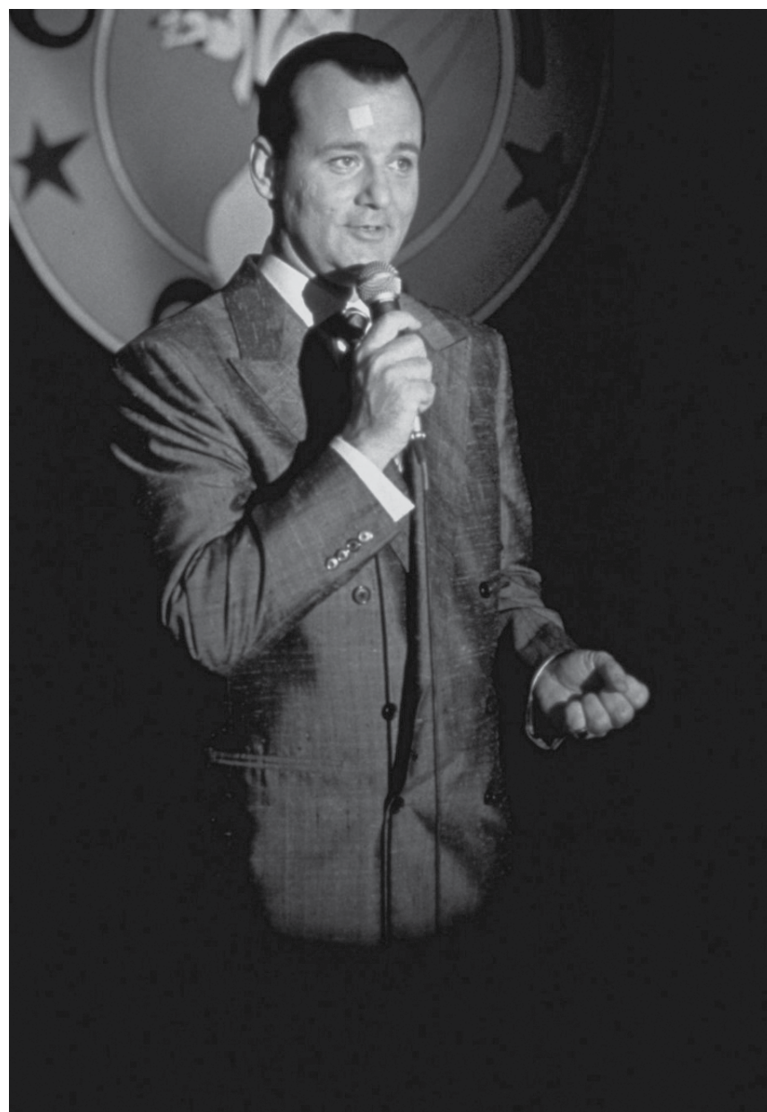
Die Cinémathèque feiert diesen Monat „Celluloid Icon“ Bill Murray, unter anderem mit dem Film „Mad Dog and Glory“, am 27. Juni.