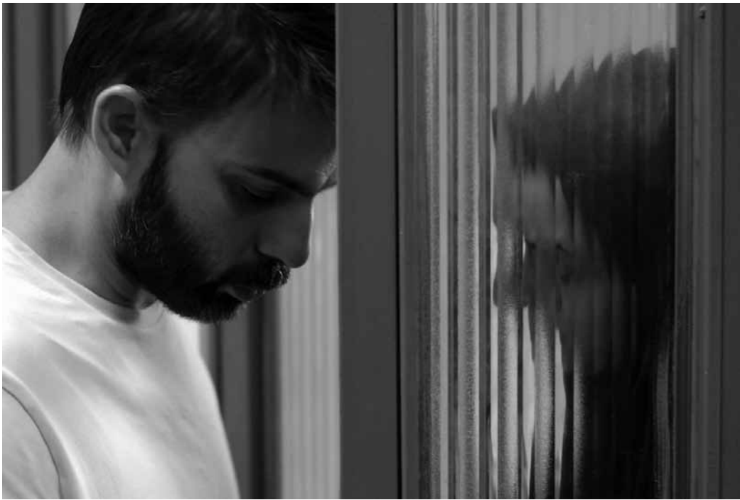
Le dialogue social en Iran reste brouillé.