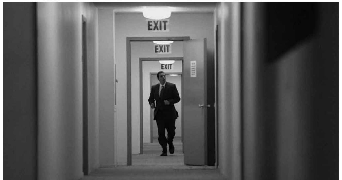
Findet aus dem Verliebtsein nicht mehr heraus: Adam Sandler in „Punch Drunk Love“, am 25. Juni in der Cinémathèque.

Une jeune femme, distinguée mais très réservée quant aux choses de l'amour ; sa soeur cadette, qui n'aime au contraire que ça : le faire et en parler ; le mari et un ancien camarade voyeur. Tableau des moeurs d'une