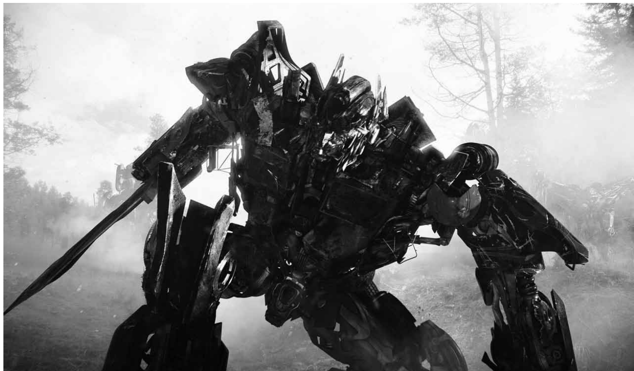
Das letzte Gefecht, danach wird hoffentlich recycelt: „Transformers 3: Dark of the Moon“, neu im Ariston, im Utopolis und im CinéBelval.

Un drame dans l'entourage de la musique et de la culture « Trash ».