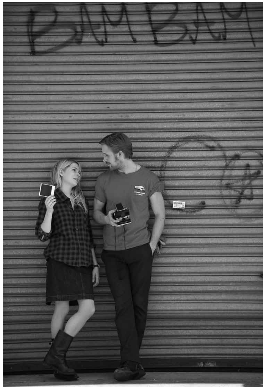
Ist die Liebe vergangen, schmerzen auch die schönsten Erinnerungen : „Blue Valentine“, neu im Utopolis.

22h30, So., Mo. + Do. 19h40 (O.-Ton, fr. + nl. Ut.), sa. + di. 14h20 (v. fr), Fr., Mo. + Di. 16h50, Sa. + So. 14h + 16h50, Do. 14h (dt. Fass.).