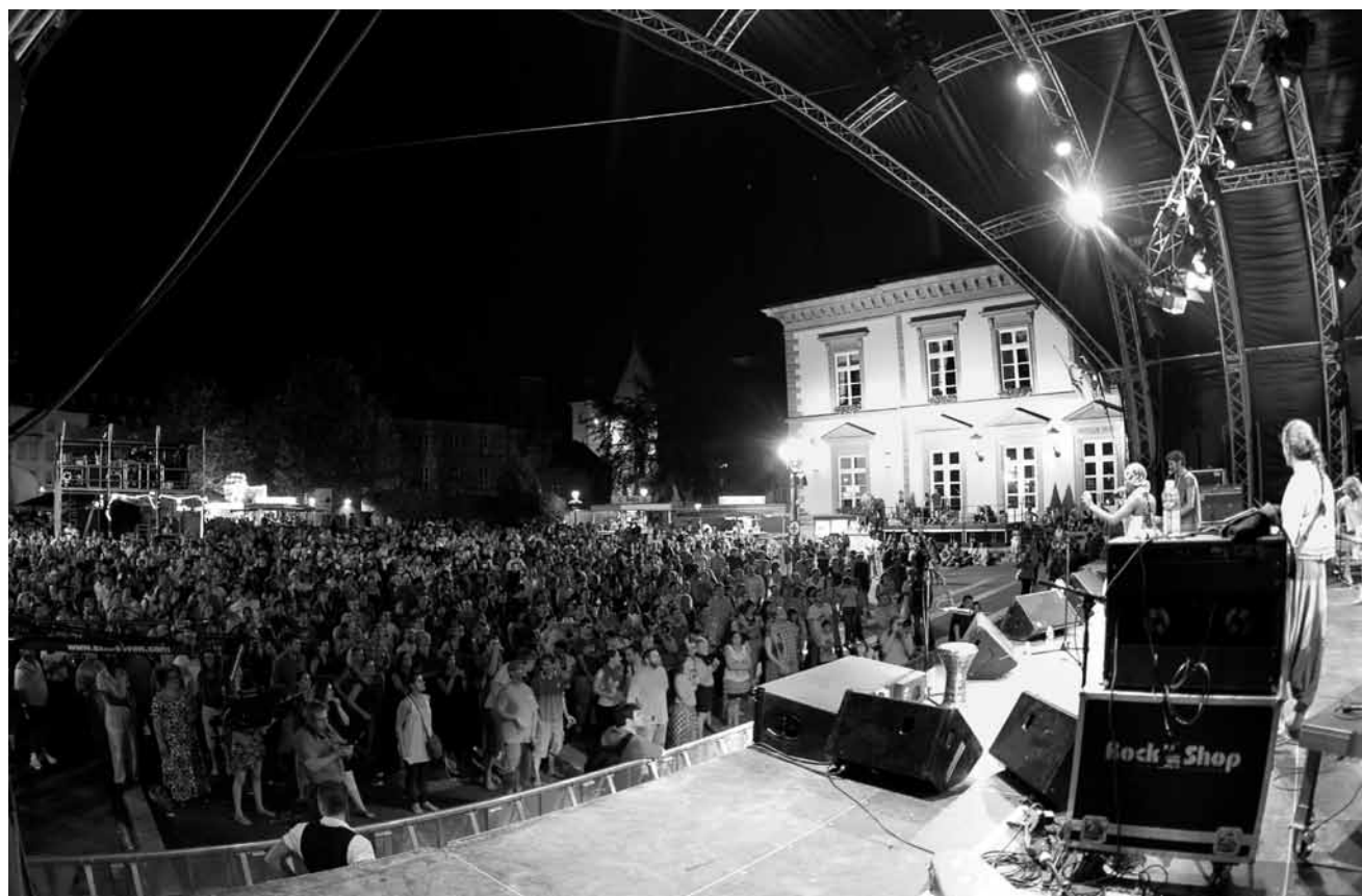
Encore une occasion de fêter le début de l'été: le « Me You Zik »-Festival avec son grand choix de musiques du monde aura lieu le 2 juillet au Knuedler.

The Midnight Moon, spectacle multi-sensoriel, interactif et féérique spécialement conçu pour des enfants ayant un polyhandicap mental ou physique ou atteints d'autisme, Philharmonie, Espace découverte, Luxembourg, 9h30, 11h15, 14h + 16h. Tél. 26 32 26 32.