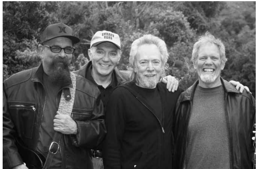
Können immer noch prima Dampf ablassen: Die Alt-Rocker von „Canned Heat“ werden am 29. Juni das Sang a Klang beehren.