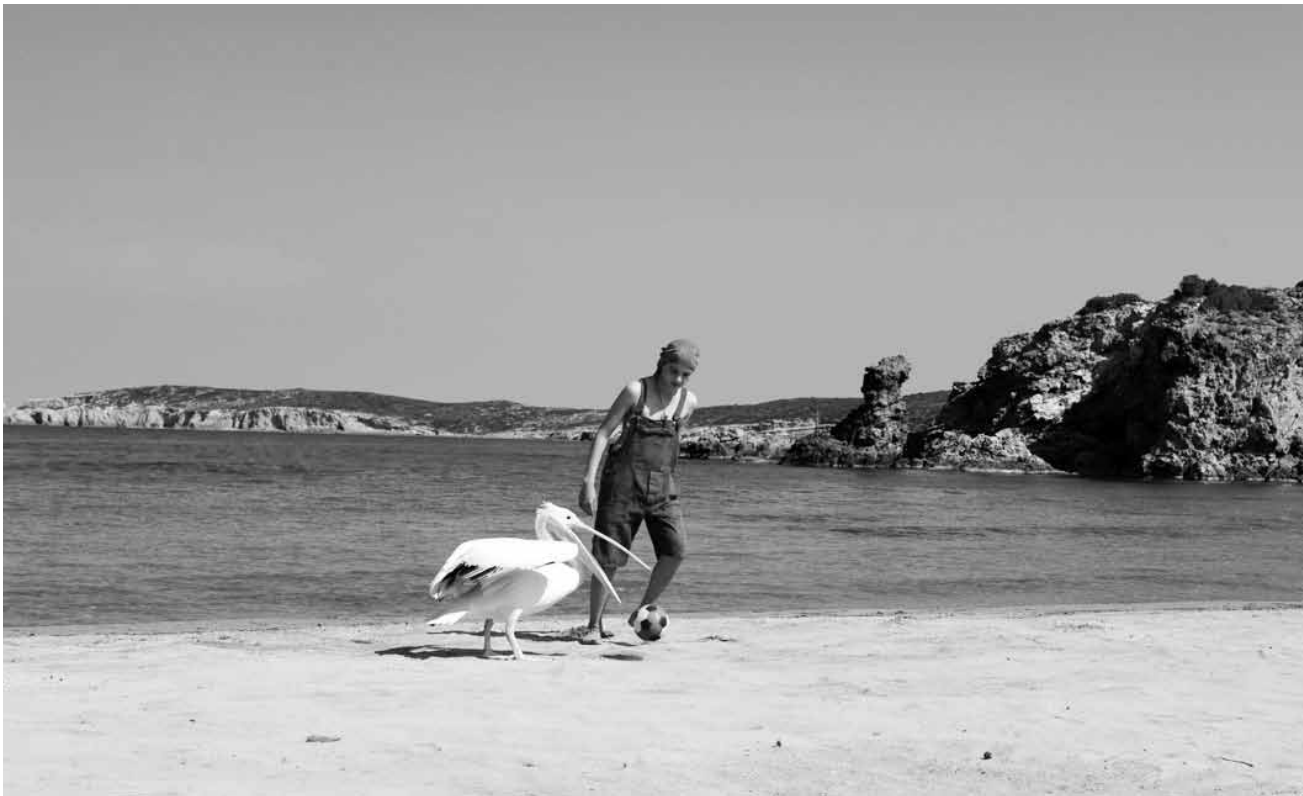
Loin des démonstrations, l'idylle se noue entre garçon et pélican.