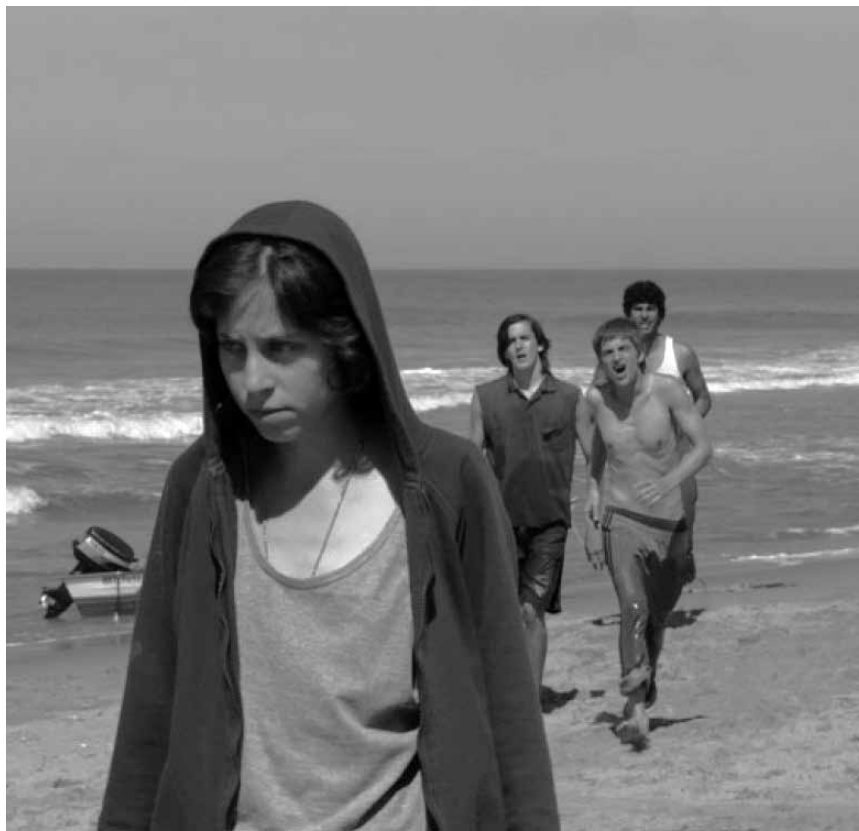
L'hermaphrodite Alex est au coeur de « XXY », drame argentin sur l'intersexualité. Lundi à l'Ariston dans le cadre du « Gaymat ».