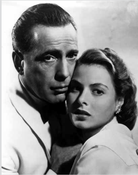
Vendredi, Humphrey Bogart et Ingrid Bergman dans « Casablanca ».

Le nouveau directeur de l'hôtel parvient à démasquer un officier nazi, responsable de la mort de ses prédécesseurs.