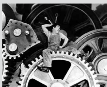
Samedi, 6.8. : Charley Chaplin dans « Modern Times »