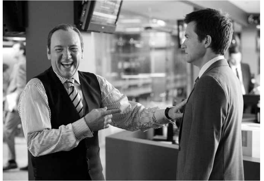
Mobbing auf die feine Art. In „Horrible Bosses“ wird mit Nächstenliebe nicht gespart. Zu sehen im Drive In in Esch-Belval.