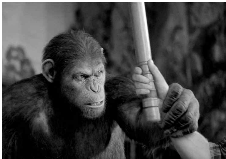
Nicht zum Affen machen lassen sich die Primaten in „Rise of the Planet of the Apes“. Neu im Utopolis und im CinéBelval.