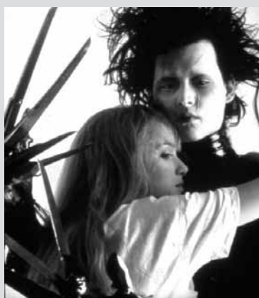
Vendredi, 5.8. : Johnny Depp et Winona Ryder dans « Edward Scissorhands »

dans le patio du Théâtre des Capucins, jusqu'au 13 août, tous les vendredis et samedis à 22h, entrée gratuite.