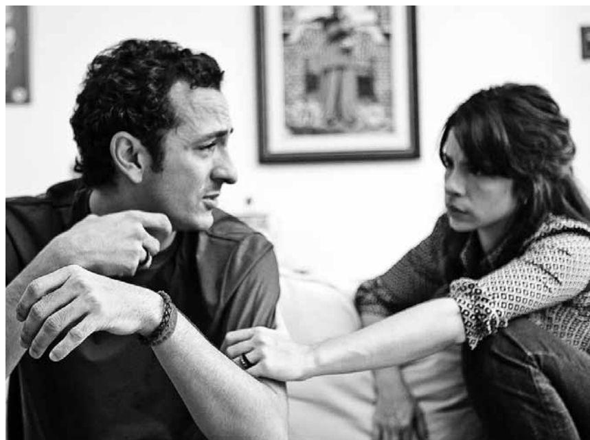
Un peu de confiance - voilà ce dont il faut dans « Tropa de Elite 2 - O inimigo agora é outro ». Nouveau à l'Utopolis.

Klara behauptet, damit sie auf dem Lande schneller Freunde kennenlernt, dass sie Pferde reiten kann. Doch das ist glatt gelogen. Der Nachbarjunge Jonte ist ihr mit dem Pferd Star gern