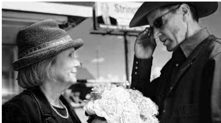
Sag es durch die Blume - um Beziehungsdramen geht es in „Don't Come Knocking“, am Freitag in der Cinémathèque.