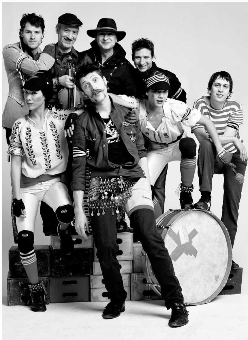
Gypsy und Punk - geht das? Gogol Bordello macht es möglich. Zu sehen am 10. August im Atelier.

Zeit zum woxx lesen , diesmal extra gründlich, auf dem Balkon oder im Garten, zu Hause oder bei Freunden, 18h.