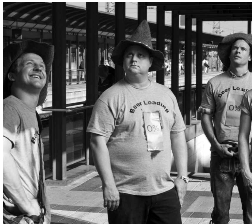
Sommerliche Klamotte aus Deutschland: „Resturlaub“, neu im Utopopolis.

Ein Ehepaar und ihre frisch verlobte Tochter samt ihrem Angebeteten machen eine Reise nach Paris, der