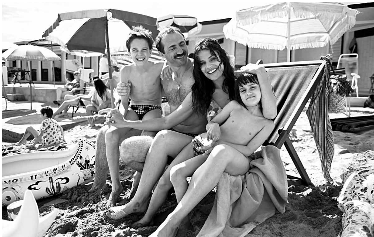
Eine Mutter mit vitalem Lebensstil ...