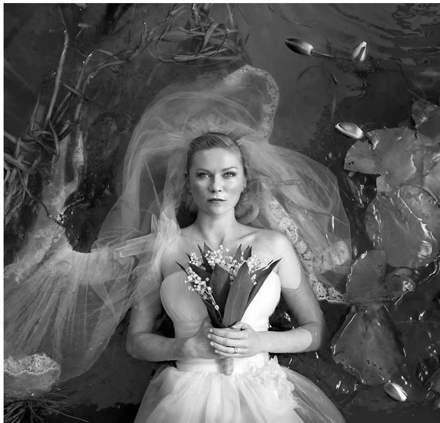
Kirsten Dunst im Endzeitepos vom eigenwilligen Regisseur Lars von Trier: „Melancholia“, neu im Utopa.