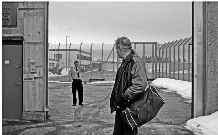
Aus Norwegen Stellan Skarsgard in einer Ganovenkomödie mit trockenem Humor: „En ganske snill Man“, neu im Utopa.

Weil sein einst brillanter Vater an Alzheimer leidet, beginnt der Wissenschaftler Rodman an Schimpansen zu experimentieren, um ein Heilmittel zu finden. Der Affe Caesar wird durch die Einnahme von diesen Medikamenten hyperintelligent. Aufgrund seines gewalttätigen Verhaltens wird er in ein riesiges Käfigsystem mit anderen Schimpansen gesperrt. Dort zettelt Caesar einen Aufstand an - die Revolution der Affen.