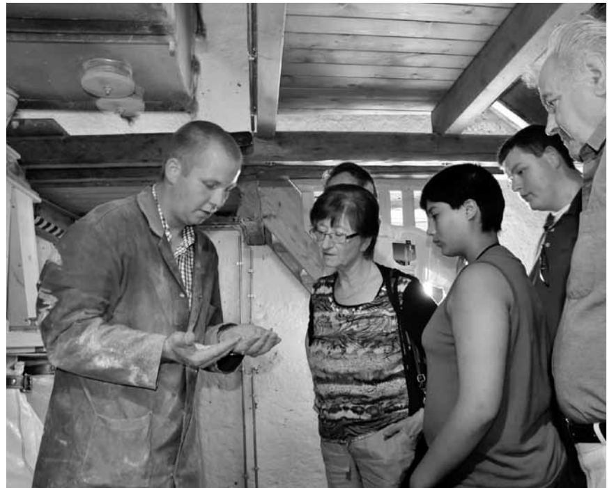
Wo das Getreide zu Mehl wird. Einen Blick ins Innere einer Mühle können BesucherInnen in Enscheringen werfen. Beim Mühlenfest am 16. August.