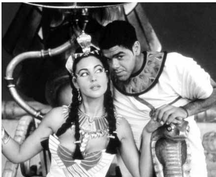
Numérobis et Cléopâtre doivent faire confiance à la nouvelle main-d'œuvre gauloise... « Astérix et Obélix : Mission Cléopâtre », ce vendredi à la Cinémathèque.