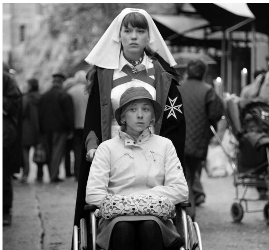
Comment vivre avec un miracle ? C'est la question que pose le film « Lourdes », ce mardi à l'Utopia, présenté par la « Kathoulesch Kierch zu Lëtzebuerg ».