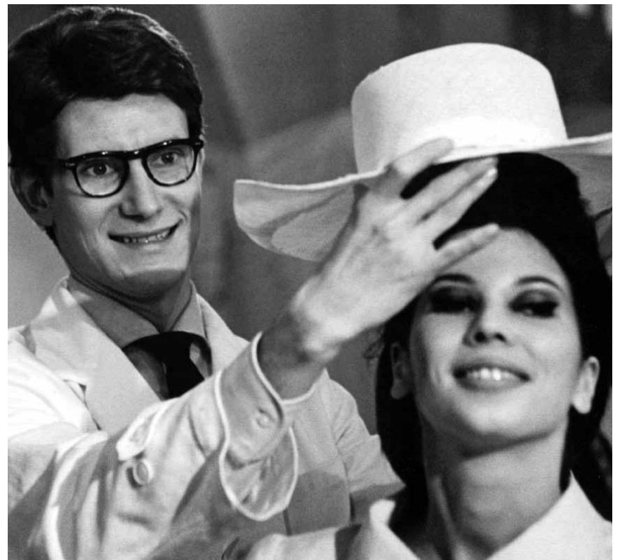
Yves Saint-Laurent, décédé en 2008, est au centre du documentaire de Pierre Thorrenon, « L'amour fou », Cinédit, ces mercredi et jeudi à l'Utopia.