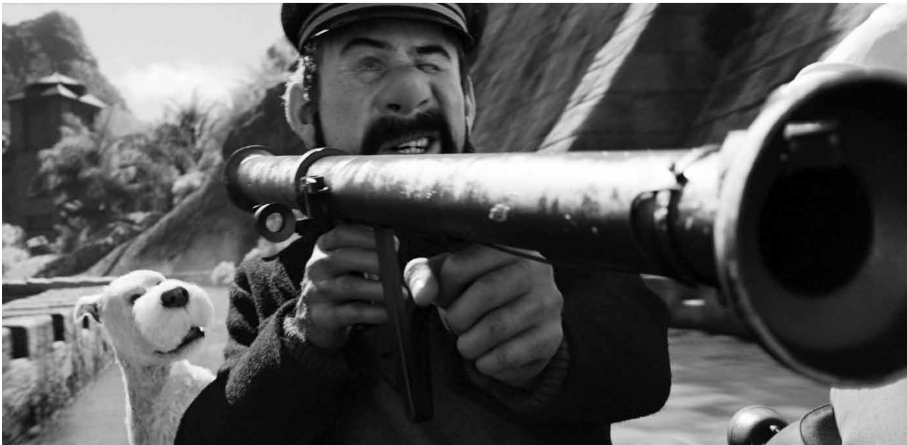
Lässt es krachen : Captain Haddock.