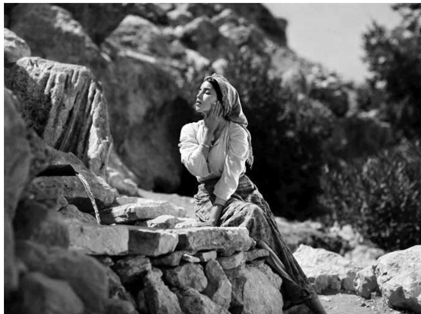
« La source des femmes » est surtout aussi l'origine de leur émancipation... Nouveau à l'Utopia.

Wieder erlebt der kleine Wickie ein großes Abenteuer, bei dem er dieses Mal seine Führungsqualitäten