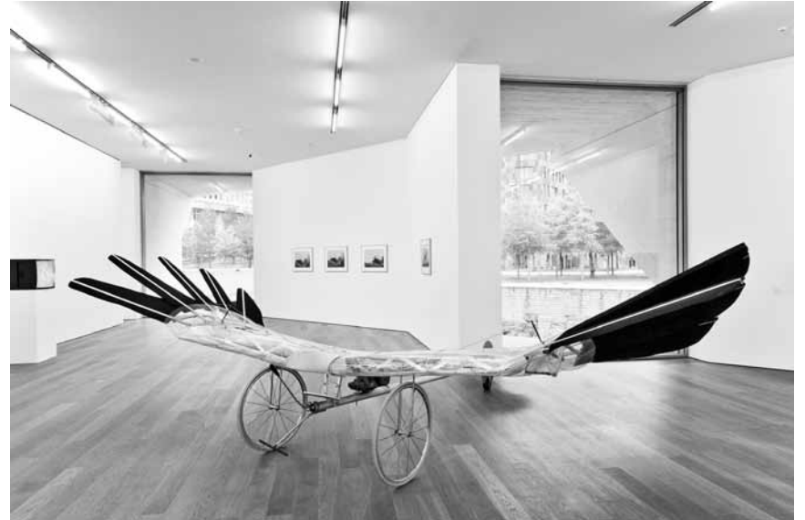
Voler pour mieux atteindre les « Mondes inventés - mondes habités » au Mudam, jusqu'au 15 janvier 2012.