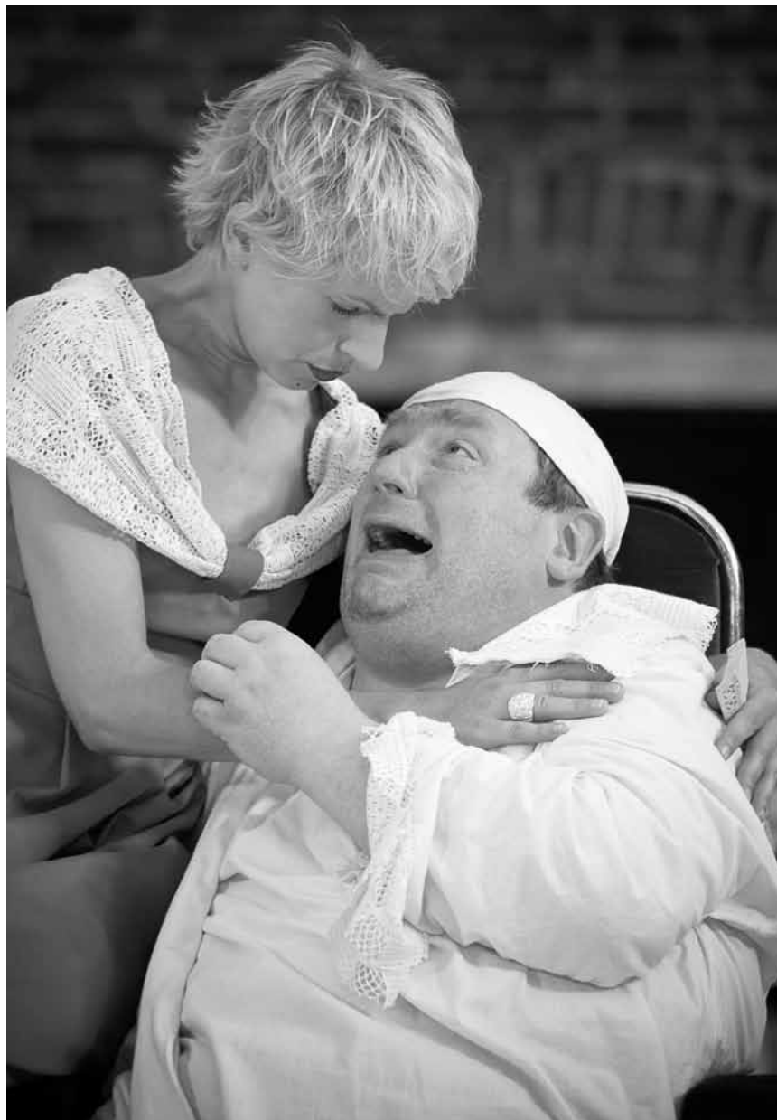
Hypochondrie, quand tu nous tiens, « Le malade imaginaire », de Molière, le 8 novembre à la maison de la culture d'Arlon.

Gefülllosigkeit und das unedle Sentiment der Passivität - Gedanken zur Schriftenreihe der dOKUMENTA (13) und darüber hinaus , mit Chus Martinez, Casino Luxembourg - Forum d'art contemporain, Luxembourg , 18h30. Tel. 22 50 45. Im Rahmen der „Mardis de l'Art“.