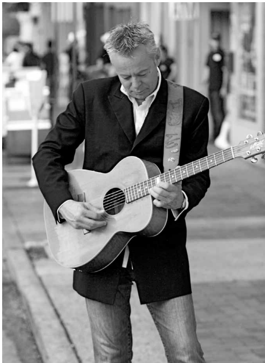
Australisches Gitarrenwunder: Tommy Emmanuel besucht am 9. November das Conservatoire in der Luxemburg.