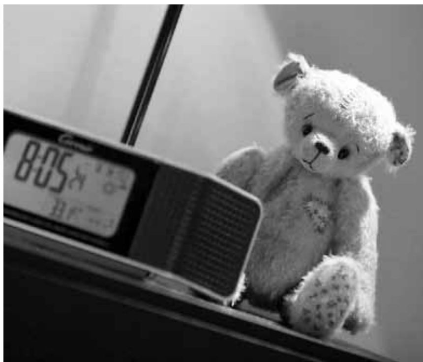
Der Teddybär des Todes... steht im Mittelpunkt des luxemburgischen Horrorfilms „The Cuddly Toy“, neu im Utopolis.