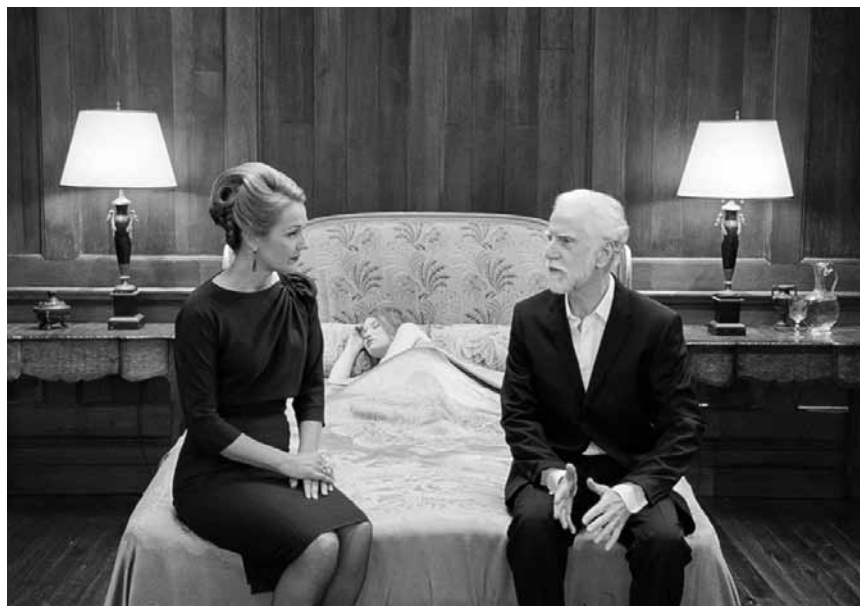
Ein mutiger Film über Altherrenfantasien und Studentinnen in Geldnöten: „Sleeping Beauty“, neu im Utopia.

Malgré une histoire très lourde en clichés, le jeu d'acteurs en fait un film familial plutôt bien foutu. (lc)