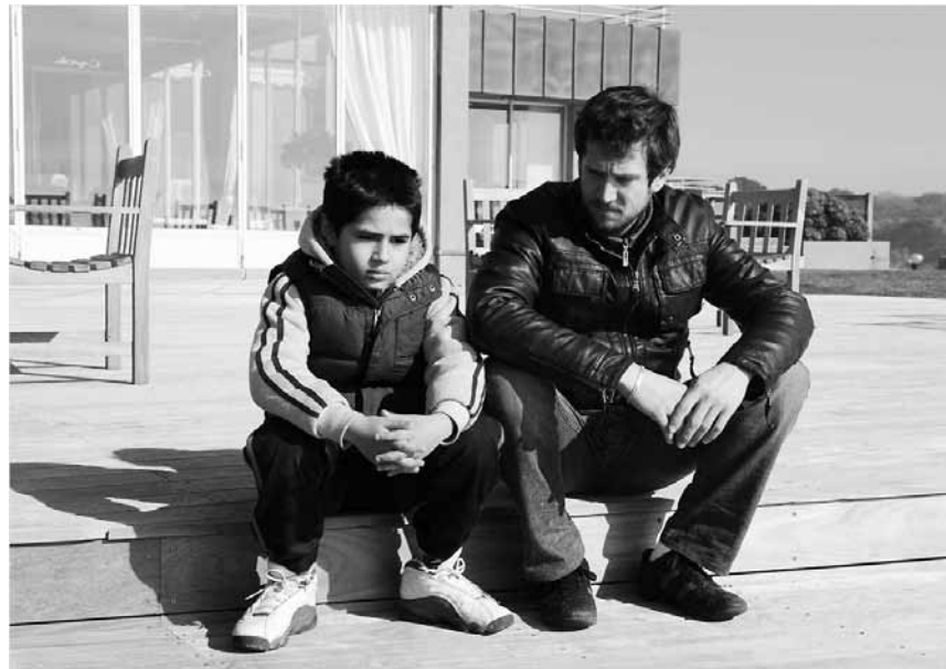
Quand la crise brise des vies : « Une vie meilleure » avec Guillaume Canet, nouveau à l'Utopia.