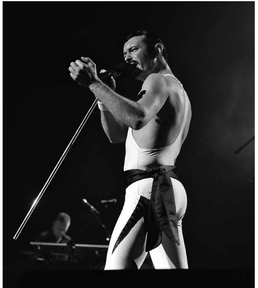
Freddy kehrt zurück, wenn auch nur für eine Nacht: „One Night of Queen“, an diesem Freitag, dem 20. Januar in der Rockhal.