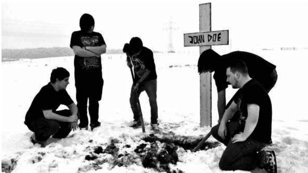
Vont déterrer le métal vieux jeu : We Knew John Doe.