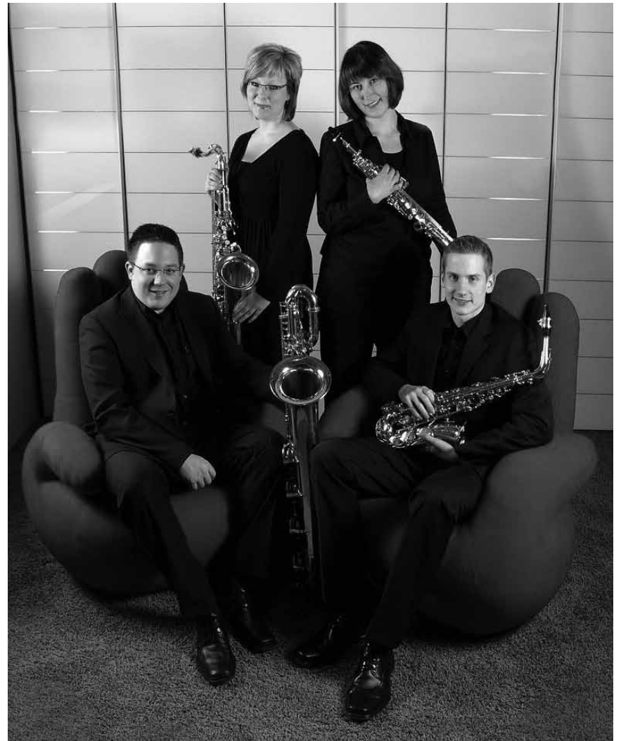
Quand quatre instruments convergent, la « Tetraphonie » s'installe, le quatuor de saxophones sera au Trifolion d'Echternach le 29 janvier.

Madama Butterfly , Oper von Giacomo Puccini, Saarländisches Staatstheater, Saarbrücken (D), 19h30. Tél. 0049 681 30 92-0.